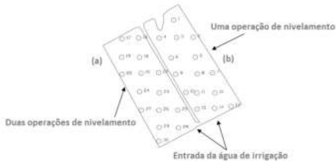
Figura 2 – Croqui da área experimental com seus respectivos pontos de coleta: (a) duas operações de nivelamento da superfície do solo; e (b) uma operação de nivelamento.

cultivo mínimo. O número de operações de nivelamento da superfície do solo foi alterado, constituído de uma e duas operações de nivelamento, onde se fez o uso de um conjunto mecanizado constituído de trator e plaina niveladora hidráulica acoplada a barra de tração.