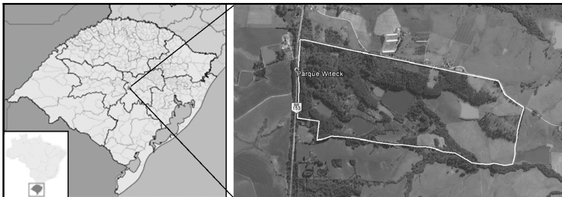
Figura 1: Localização do Município de Novos Cabrais no Estado do Rio Grande do Sul/BR e imagem do local de estudo (Parque Witeck).

Fonte: Os autores. Adaptado de Google Earth 2014 – data da imagem 15/08/2013.