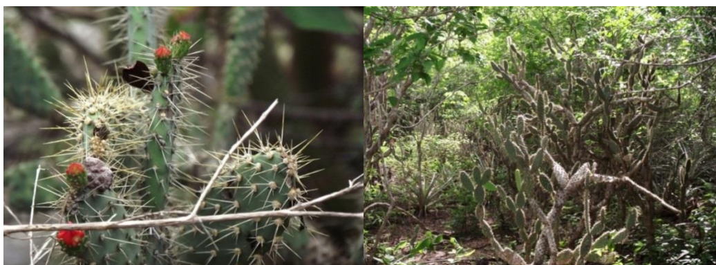
Figura 1. Indivíduos de T. palmadora numa área preservada de Caatinga, Sítio Caldeirão, Município de Boa Vista, PB (1A); Detalhe de cladódios apicais (1B).

Foram amostrados 1.883 indivíduos de T. palmadora (Figura 1A e 1B) com densidade absoluta de 1.883 ind. ha -1 , frequência absoluta de 100% e padrão de distribuição uniforme (Índice de McGuinnes, IGA<1,0). Uma das características que leva a população vegetal a essa distribuição espacial está na forma da síndrome de dispersão da espécie. (Silva e Rodal, 2009), disseminam as sementes ao longo do seu ambiente de nicho. Condição favorecida pela presença funcional de animais dispersores, de modo que a espécie tem ocupação em quase totalidade dos sítios de ocupação da área (Figura 2A).