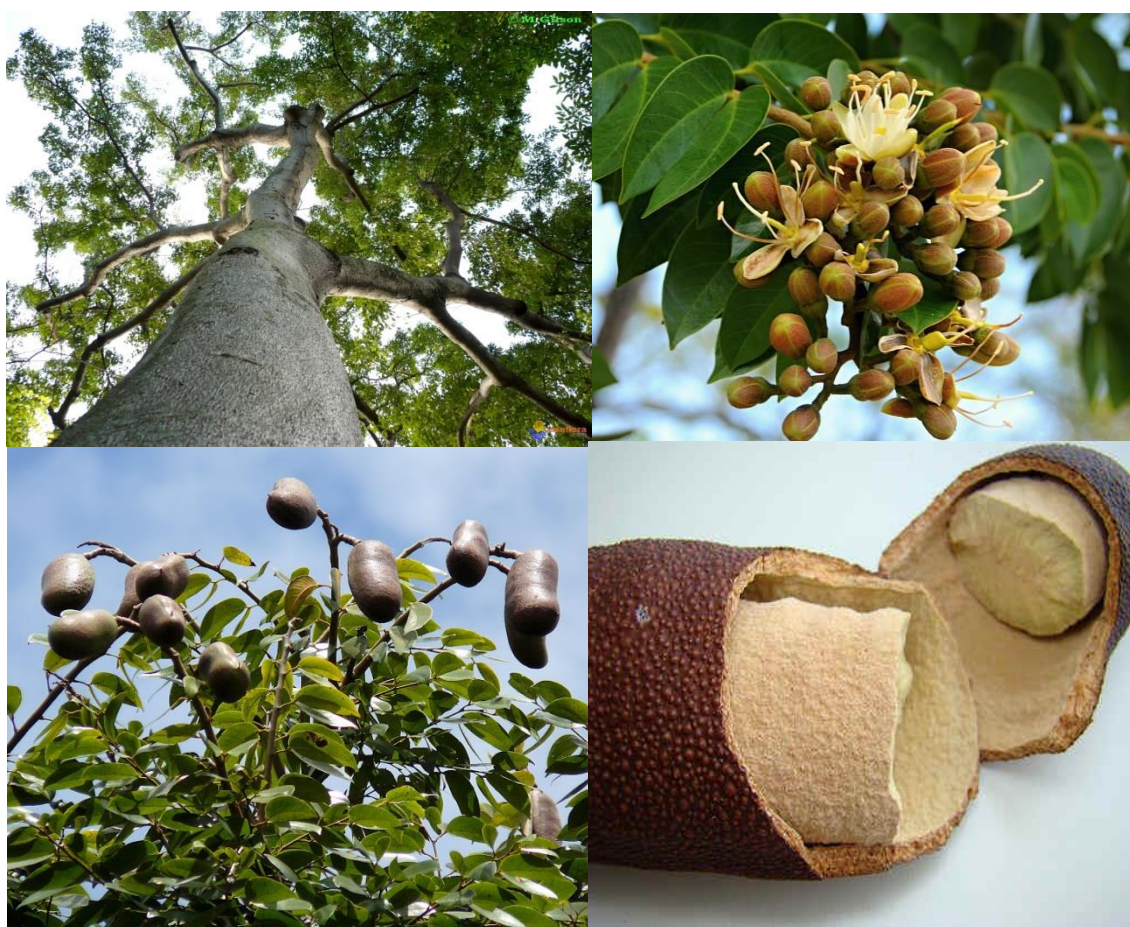
Figura 2 - Ilustração de Hymenaea courbaril L. mostrado o caule, as flores e os frutos desta espécie de jatobá.

Extratos hidroetanólicos brutos obtidos do súber desta planta mostraram propriedades antibióticas ao ser testado contra o isolado clínico meticiclina-resistente de Staphylococcus aureus (MRSA) (Aleixo et. al, 2013). O flavonóide astibilina e o ácido oleanólico isolados do súber de Hymenaea courbaril apresentaram atividade relaxante sobre o musculo-liso traqueal de ratos pré-contraídos com K^+ , demonstrando propriedades miorelaxante, antioxidante e antiinflamatória (Bezerra, 2013). Bontempo (2000) relata que o súber desta espécie, em cozimento, é eficiente no tratamento de hemoptises, hematúria (emissão de urina com sangue), diarreia, disenteria, cólicas ventrais, e acrescenta que o vinho de jatobá retirado do caule é um potente fortificante para os músculos e ossos.