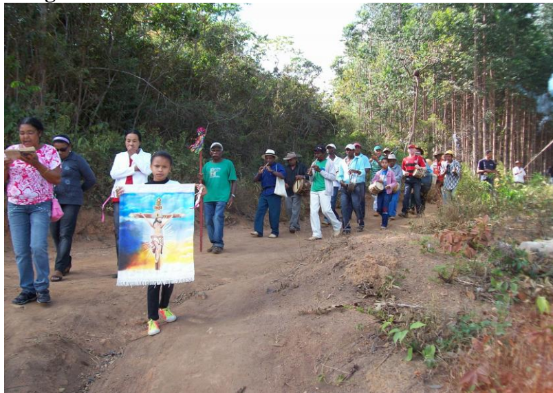
Fig. 01 – Procissão de busca da bandeira de Bom Jesus

É este o cenário em que mergulhamos reflexivamente, e procuramos compreender as relações da escola com esta realidade quilombola. Nela localizamos os jovens alunos, dois meninos e duas meninas, com quem dialogamos ao longo da pesquisa.