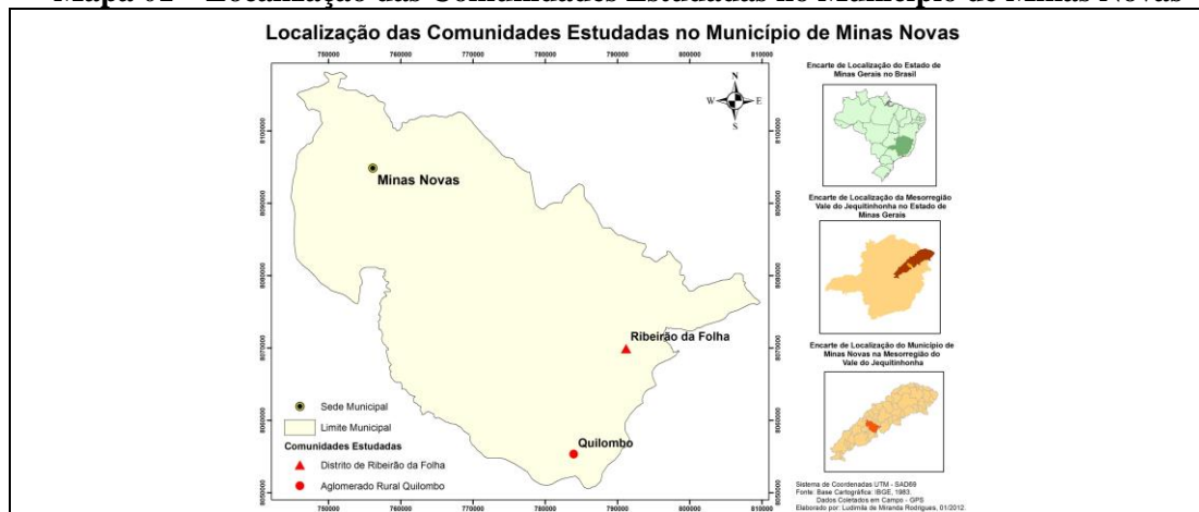
Mapa 01 – Localização das Comunidades Estudadas no Município de Minas Novas