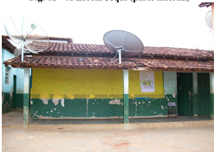
Fig. 02 – A Escola Jequi (parte interna)

disponibilizam a lecionar no Distrito. Em toda a região, a escola é a única instituição que oferece o ensino médio, deste modo, adolescentes e jovens chegam de várias comunidades para tentar cursá-lo, enfrentando problemas sérios, como a precariedade do transporte escolar e a falta do mesmo em dias de chuva.