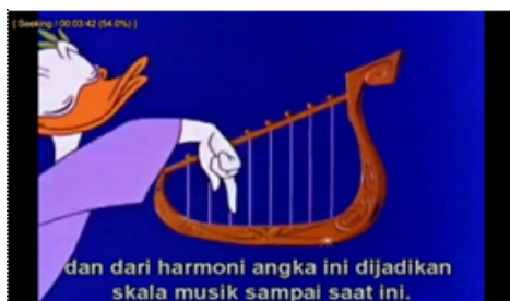
Gambar 3. Video Math Magic Land

Video (perhatikan Gambar 3) yang ditampilkan meningkatkan atensi siswa dan relevansi pelajaran terhadap kehidupan siswa. Hal ini terlihat dari hasil wawancara yang menyebutkan bahwa siswa menyukai video tersebut karena menampilkan hal baru berupa keterkaitan matematika dengan musik. Kaitan matematika dengan musik membuat siswa mengetahui matematika berkaitan dengan hal yang familier dalam kehidupan sehari-hari yaitu musik. Meskipun video berhasil meningkatkan atensi siswa, hal ini hanya bertahan pada awal pembelajaran. Oleh karena itu, pada siklus selanjutnya perlu didesain pembelajaran yang membuat siswa memiliki atensi lebih lama.