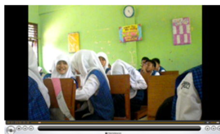
Gambar 2. Situasi Kelas saat Penelitian Pendahuluan

Refleksi dari penelitian pendahuluan adalah siswa kurang tertarik dengan kegiatan pembelajaran matematika. Dari 6 SP, 4 diantaranya menyatakan bahwa pembelajaran membosankan karena terlalu biasa dan kurang menantang. Hasil pengamatan menunjukkan bahwa siswa mulai tidak memperhatikan peneliti pada menit ke-10 dalam kegiatan penjelasan materi. Setengah dari siswa yaitu 56,4% siswa menyatakan setuju bahwa pembelajaran menarik. Berikut adalah gambaran situasi kelas saat penelitian pendahuluan.