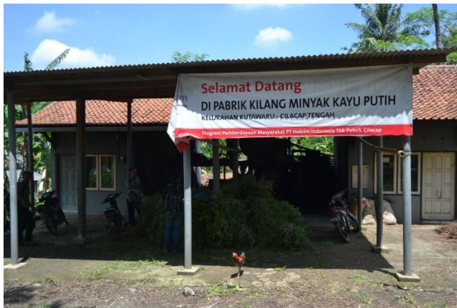
Gambar 3 Pabrik Pengolahan Minyak Kayu Putih

Di Desa Kutawaru terdapat industri pengolahan minyak kayu putih yang dilakukan oleh warga setempat dengan binaan program CSR Holcim. Tanaman kayu putih berasal dari lahan perhutani yang berada di Desa Kutawaru sendiri sehingga bahan baku untuk industri pengolahan minyak kayu putih ini tidak ada masalah. Terdapat juga kolam pemancingan air laut yang dapat dimanfaatkan oleh pengunjung di Desa Kutawaru untuk bersantai.