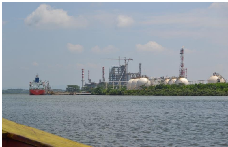
Gambar 2 Pemandangan Aktivitas Industri