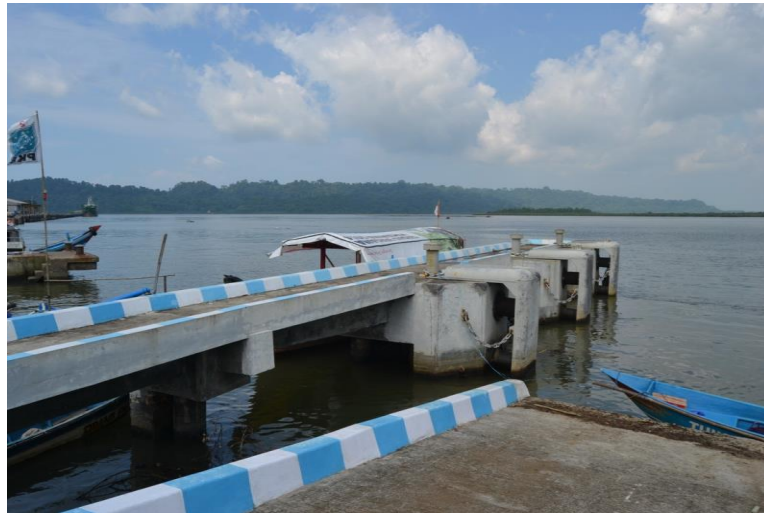
Gambar 1 Dermaga Pelabuhan Sleko

dengan kursi dan televisi, parkir area dan kantin atau tempat makan yang dapat dimanfaatkan oleh pengunjung.