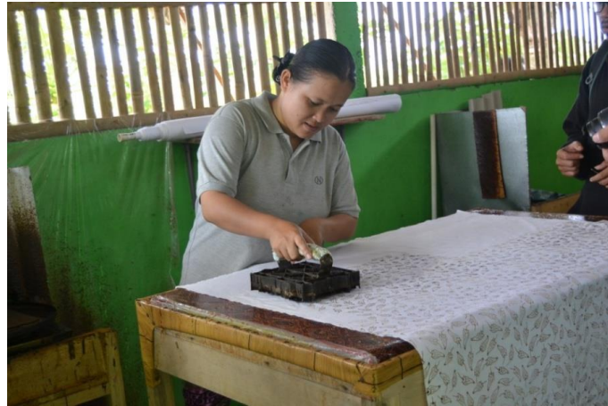
Gambar 4 Aktivitas di Sentra Batik Desa Kutawaru

pembuatan batik, mengikuti proses pembuatan batik, dan dapat membeli batik yang sudah jadi.