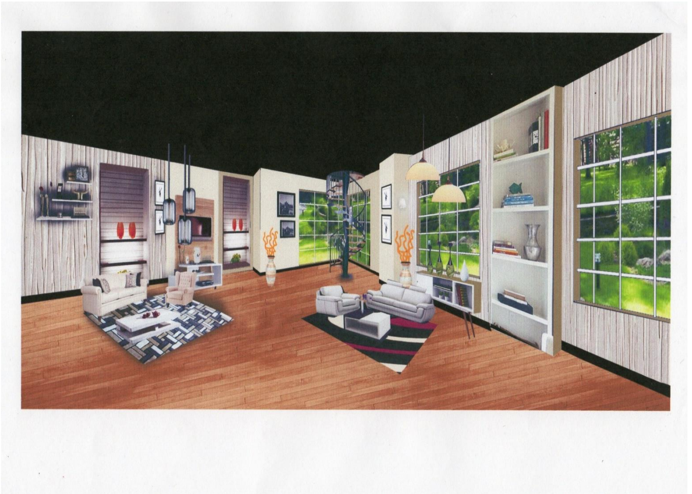
Gambar 2. Desain Panggung