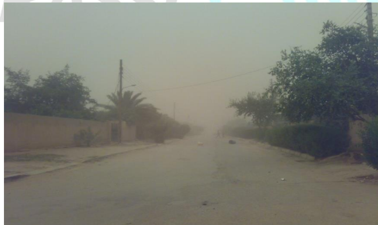
الشكل (4): عاصفة ترابية في مدينة النجف الأشرف