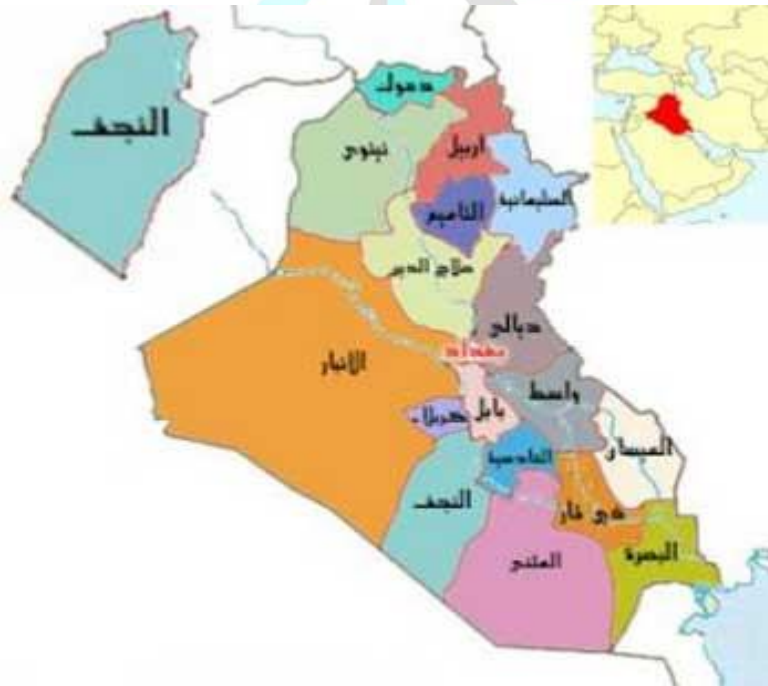
شكل (1): خارطة العراق تبين موقع مدينة النجف الاشرف.

مما تقدم ومن الشكل (1) نجد بان مدينة النجف الاشرف واقع ضمن خط الاستواء ذات درجات الحرارة العالية , ومنطقة غبارية كثيرة العواصف الرملية مما يؤثر على ممارسة الأنشطة الرياضية في الأماكن العامة.