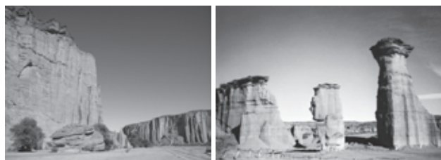
Figura 1. Orografía del Parque Nacional de Talampaya, al sudoeste de la Provincia de La Rioja, Argentina.

Geológicamente, la región no posee grandes diferencias en altura, salvo la presencia de algunos cerros aislados. La orografía del Parque Nacional Talampaya se asocia estrechamente con los rasgos tectónicos. El control estructural muestra los bloques ascendidos como las líneas dominantes topográficamente (Figura 1).