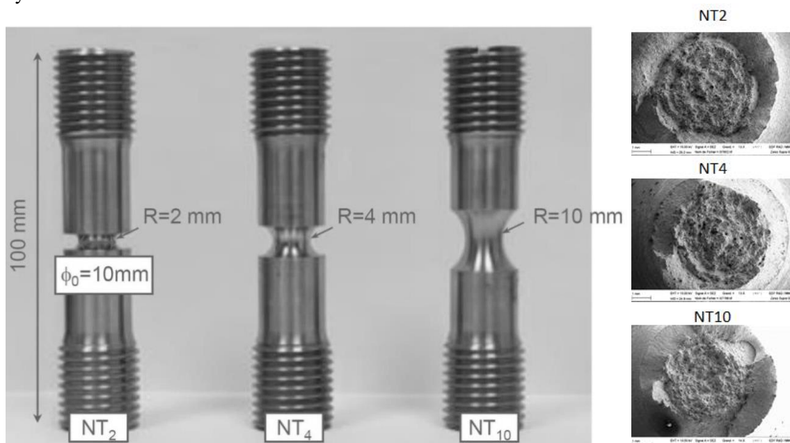
1. ábra Szakító próbatestek

A kutatás alapját egy ferrites acélból készült csőszerszervény képezte. A GTN modell paramétereinek meghatározásához első lépésként szakítóvizsgálatot végeztünk el, mely során három különböző bemetszésű próbatestet vizsgáltunk meg, mivel a bemetszések sugarának változtatásával változik a feszültség triaxialitás aránya. Az 1. ábra az egyes próbatestek főbb méreteit illetve a törétfelület pásztázó elektronmikroszkóppal (SEM) készített felvételeit mutatja be. A szakítóvizsgálatból kapott eredményeket a későbbiekben kerülnek szemléltetésre.