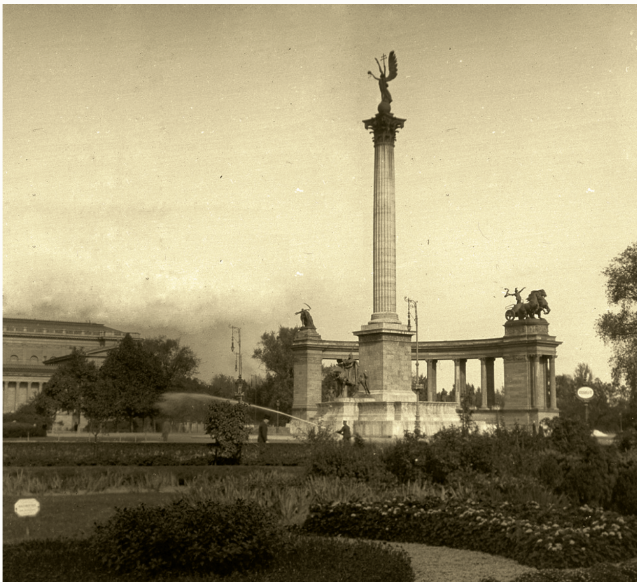
Az Ezredévi emlékmű - részlet, 1914