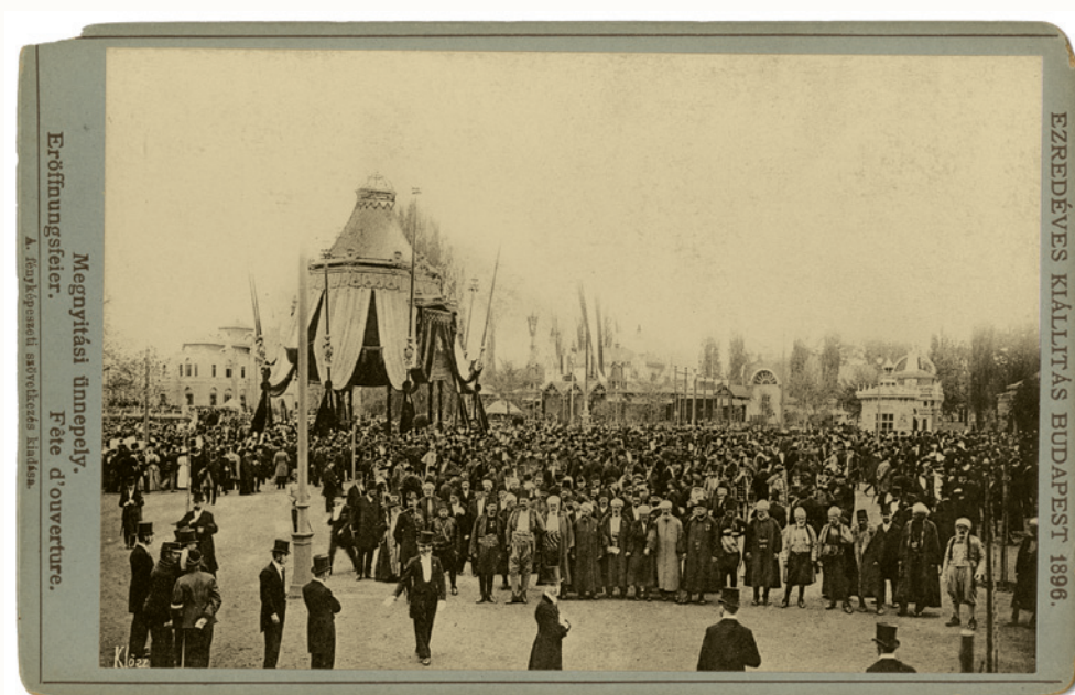
Az 1896-os millenniumi ünnepségsorozat megnyitása

Ez már nem a nagy álmok, hanem az álmok megvalósulásának a korszaka – legalábbis a várostervezés és az építészet terén. A millennium ünnepére további impozáns, világvárosi üzenetet hordozó építményeket adnak át. Felépül a Vígszínház (az Operaház már 12 éve működik), elkészül a Ferenc József híd (a mai Szabadság híd), Lechner Ödön Iparművészeti Múzeuma, vagy a folyamatosan épülő Parlamenttel szemben a Kúria épülete. Noha az Erzsébet híd átadása csúszik, néhány év múlva megnyílik a Szépművészeti Múzeum, és a század elejére a Parlament is. Az amerikai tempójú építkezési láz és városfejlesztés egyben nemzeti identitásépítés is. Ebben a kegyelmi állapotban Magyarország történelme során példátlanul magas költségvetési támogatásban részesült a városfejlesztés, a kultúra és a művelődés. Az ország vezetése megértette a szimbolikus és kulturális terek fontosságát, a műveltség, az oktatás és a tudomány szerepét a gazdasági felemelkedésben és a nemzetközi elismertség elnyerésében. Akkor is, ha az új intézmények működésének tartalmi meghatározásában a kormánynak nem minden döntése szolgált a felzárkózást és az élvonalba kerülést.