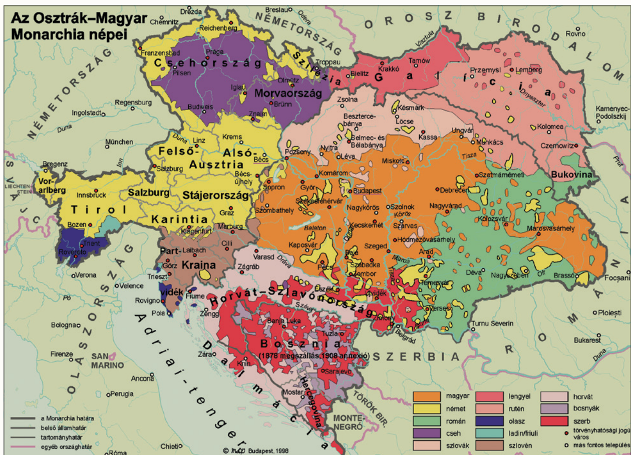
Az Osztrák–Magyar Monarchia népei, 1910

Bár a korszak üzenetét pontosan kódolva Budapest néhány év alatt látszatra kozmopolita és európai metropolisszá válik, ellentmondásait egyre nehezebben tudja kezelni, nőnek a társadalmi feszültségek. Politikai súlyának növekedése sem a Monarchián belül, sem azon kívül nincs arányban kulturális és anyagi gyarapodásával. Az elbizonytalanodás és a megtorpanás társadalmi és kulturális dimenziókat is ölt.