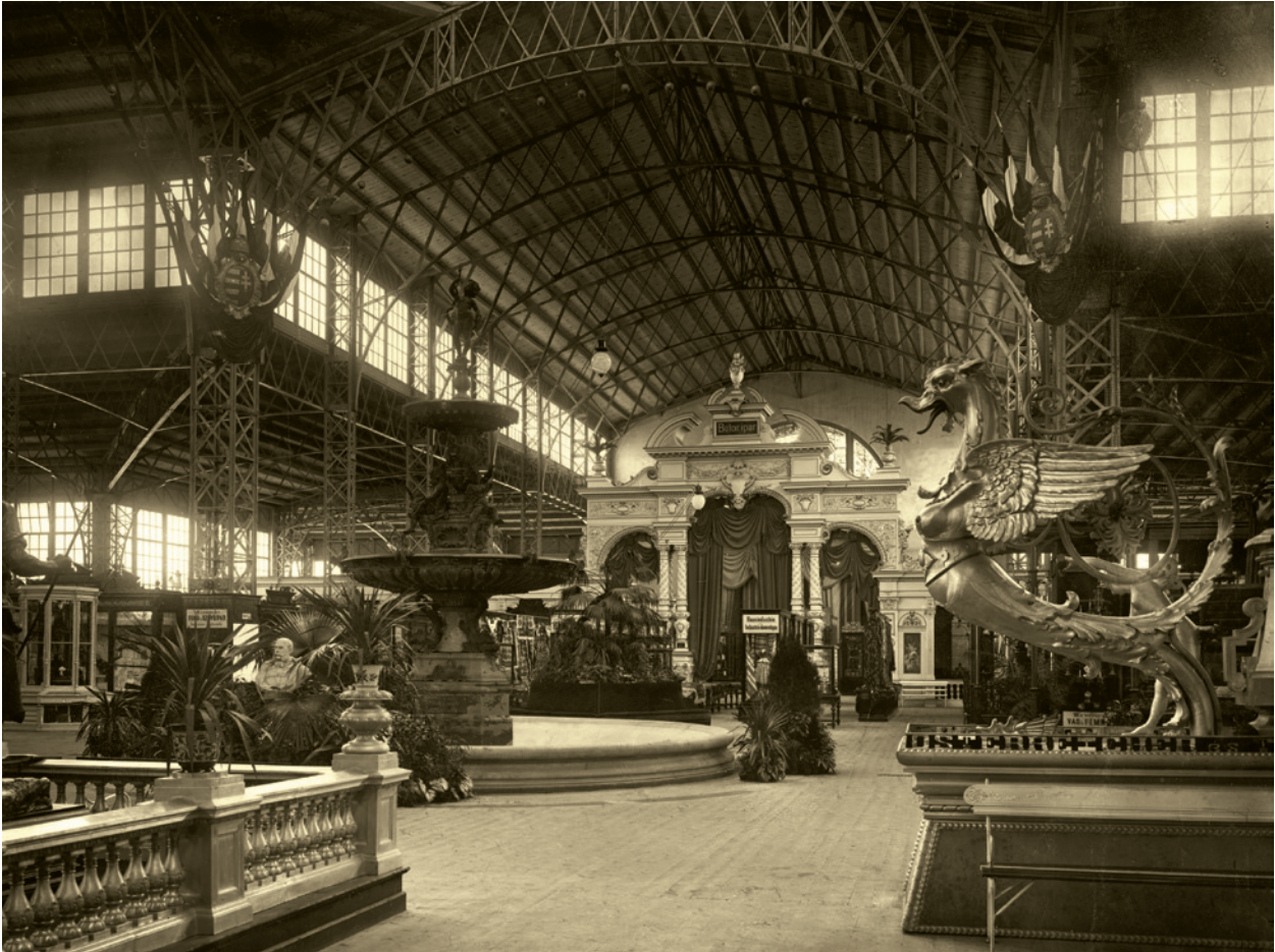
Modern pavilion, a Millenniumi Kiállítás Iparcsarnoka