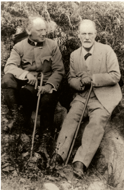
Sigmund Freud és Ferenczi Sándor, 1917

erősebben rányomja bélyegét a magyar konzervatív tudományos elit, s az orvoscépzést kézben tartó, antiszemita nézetektől sem mentes szakmai kör, amely a pszichoanalízis népszerűségének növekedése ellenére sem engedi kibontakoztatni annak intézményesülési törekvéseit. Mindketten asszimilálódó zsidó kispolgári család sarjaként választják az orvosi pályát, mint abban a korban sok hasonló fiatal. Az orvosi pálya, csakúgy, mint a jogászoké, mérnököké és építészeké, a 19–20. század fordulóján a zsidó középosztály számára asszimilációs lehetőséget és a felfelé ívelő társadalmi mobilitás ígérteit hordozta. Ezen kívül a tudományos diszciplínák közül a biológia, az orvostudomány és a műszaki tudományok (a technikai fejlődésnek köszönhetően is) gyorsan professzionalizálódtak és intézményesültek. A neurológia, a nőgyógyászat és a belgyógyászat kifejezetten ugrásszerű fejlődésnek indult, és jövedelmezőnek bizonyult a szakorvosok számára is.