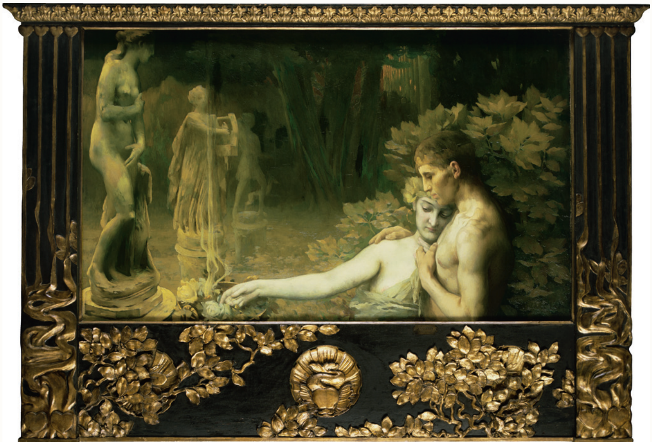
Vaszary János: Aranykor , 1898.

bizakodó életérzést produkált a nagyobb háborúktól mentes, viszonylagos béke korszakában. Az anyagi gyarapodás mellett a kulturális és szellemi pezsgés, a felemelkedés érzete tagadhatatlan: az aranykor káprázata betölti a horizontot, elfoglalja a maga helyét a budapestiek agyában és szívében.