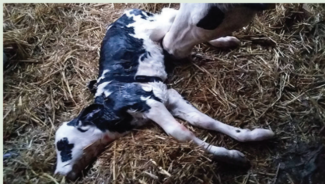
2. ÁBRA. NSAID-kezelést kapott, gyenge életképességű borjú