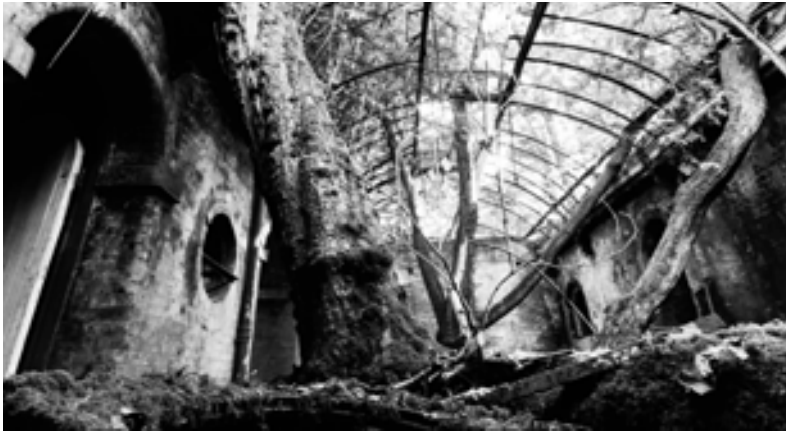
Fig. 06 Naturalezas subterráneas, infraestructuras abandonadas.