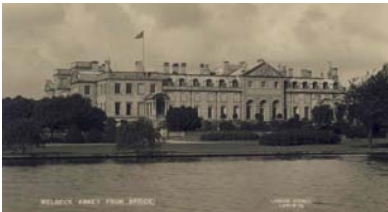
Fig. 02 Welbeck Abbey, 1860.