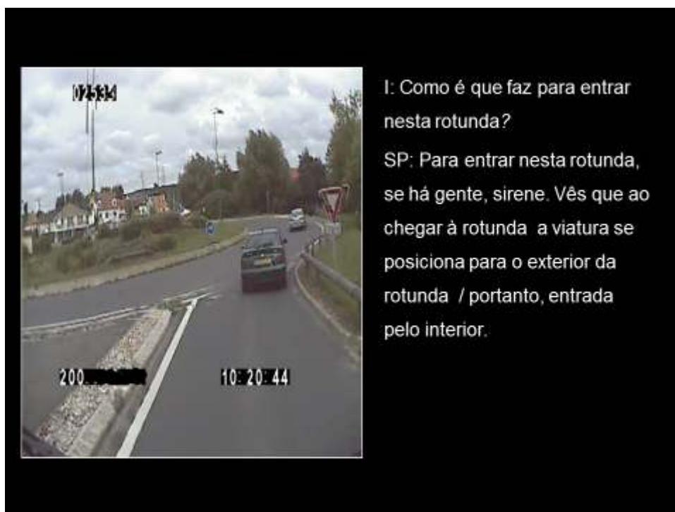
Figura 1: Exemplo de autoconfrontação

diferentes; 2 filmes para outros três operacionais; 3 filmes para um outro operacionais; 4 filmes para um operacionais e 6 filmes para outro operacional). O número de filmagens dependeu das saídas efetuadas ao longo do piquete e da disponibilidade dos operacionais para realizar as autoconfrontações. A recolha de dados foi realizada ao longo de vários dias de piquete, e há saídas tanto com VCIP como com VSR com 4 operacionais.