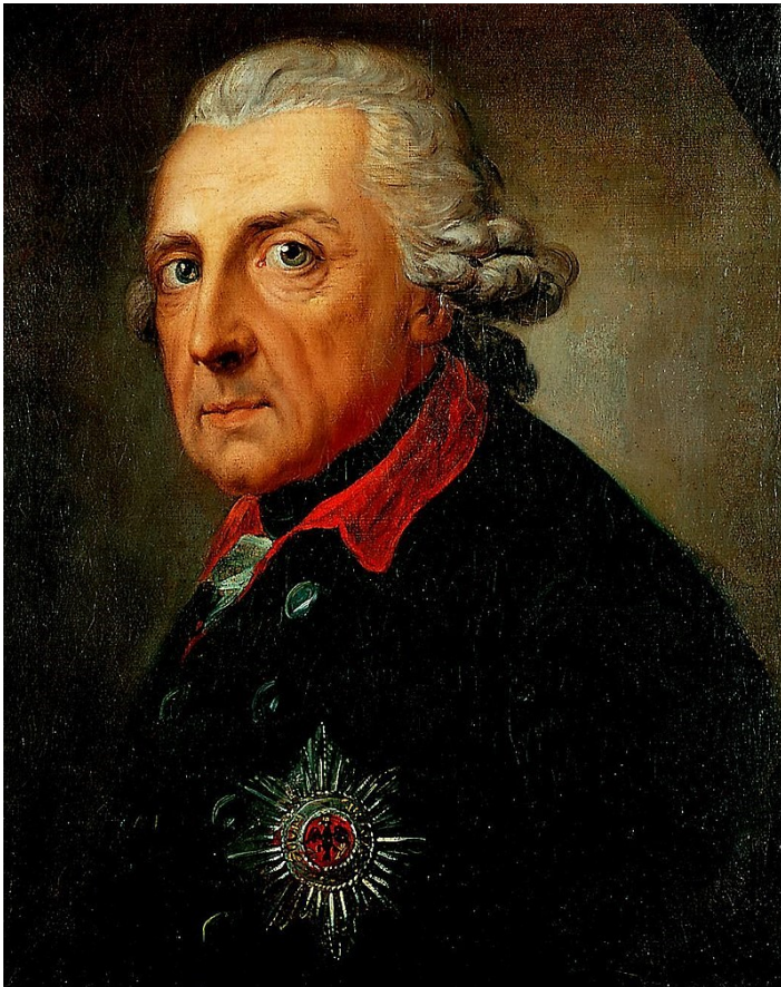
Slika 3. Portret Friedricha II. Velikog u dobi od 68 godina

Iako sklon umjetnosti i prosvjetiteljskim idejama, Friedrich Veliki bio je agresivan i samouvjeren vojskovođa. Predvodio je tada najiskusniju i najbolje opremljenu vojsku u cijeloj Europi. Najznačajniji rat koji je Friedrich Veliki vodio bio je Sedmogodišnji rat koji je trajao od 1756. – 1763. godine u kojem se borio protiv Francuske, Austrije i Rusije. Pomoću svoje snažne vojske ostvario je značajne pobjede nad Francuskom i Austrijom, a pred kraj vladavine udvostručio je veličinu Pruske. 41