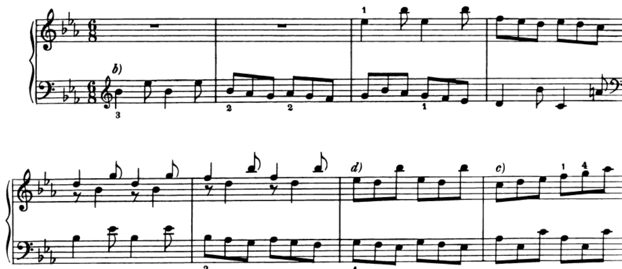
Slika 14. Gigue iz Francuske suite. br. 4, primjer francuskog tipa Gigue

U Francuskim suitama Gigue je završni stavak. Kao i ostali plesni oblici, gigue doživljava preporod u XX. stoljeću, ponajviše u djelima Claudea Debussya 108 , Arnolda Schönberga 109 i Maxa Regeera 110 .