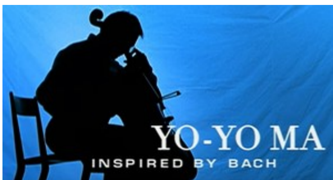
Slika 15. Yo-Yo Ma, Inspired by Bach

U prvoj epizodi „ The Music Garden “ surađuje s arhitekticom koja mu pomaže kreirati vrt na temelju prve Suite za violončelo solo Johanna Sebastiana Bacha. U drugoj epizodi „ The Sound of the Carceri “ svira drugu Suitu za violončelo solo te istražuje vezu između arhitekture i glazbe. U trećoj epizodi „ Falling Down Stairs “ koreograf pokušava osmisliti ples vezan uz treću Suitu za violončelo solo. Četvrta epizoda „ Sarabande “ napravljena je u obliku drame u kojoj se istražuju odnosi između vozača limuzine, doktora i trgovca nekretninama međusobno te njihov odnos sa Yo-Yo Maom dok on putuje u Kanadu. Ova epizoda povezana je sa četvrtom Suitom za violončelo solo. Peta epizoda „ Struggle for Hope “ snimljena je u Japanu gdje Yo-Yo Ma surađuje s koreografom koji pokušava osmisliti ples za petu Suitu za violončelo solo. U šestoj epizodi „ Six Gestures “ surađuje s klizačima na ledu koji pokušavaju dočarati plesove i ugođaj posljednje, odnosno šeste Suite za violončelo solo.