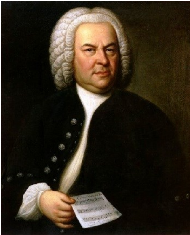
Slika 1. Portret Johanna Sebastiana Bacha iz 1746. godine

Treće razdoblje trajalo je od 1740. do 1750. godine. U ovom razdoblju Bach se više koncentrirao na neke glazbeno tehničke probleme. Od većih djela, koja su ujedno i vrhunac instrumentalne polifonije, nastale su Goldberg Varijacije, Muzička žrtva i Umjetnost fuge. Zanimljivo je to da mu je temu za Muzičku žrtvu zapravo zadao Fridrik II. 26 1747. godine za vrijeme Bachova boravka u Potsdamu. Ta tema mu je trebala poslužiti kao tema za šesteroglasnu fugu, a on je na tu temu napisao cijeli ciklus kanona 27 , fuga, ricercara 28 te čak i jednu trio sonatu.