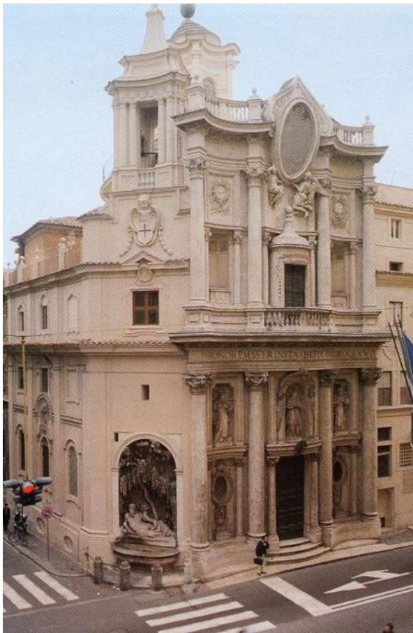
Slika 4. Crkva St. Carlo alle Quattro Fontane

Barokna arhitektura najviše se očituje u transformaciji grada Rima koji se smatrao središtem baroka. Zbog vojnih potreba tlocrti gradova najčešće su bili zrakasti (u obliku zvijezde). Žarište prostora baroknog grada su četvrtasti ili kružni trgovi 61 međusobno povezani ravnim širokim ulicama. Trgovi su imali stupove, obelisk i fontane. U crkvenoj arhitekturi prevladava centralni tlocrt sa kupolom, a teži se što većim efektima. Unutrašnjost građevine ukrašena je slikama, reljefima, skupocjenim pokućstvom i predmetima iz crkvene liturgije. Najznačajniji talijanski arhitekt bio je Francesco Borromini, a jedno od njegovih najboljih djela je svakako crkva St. Carlo alle Quattro Fontane .