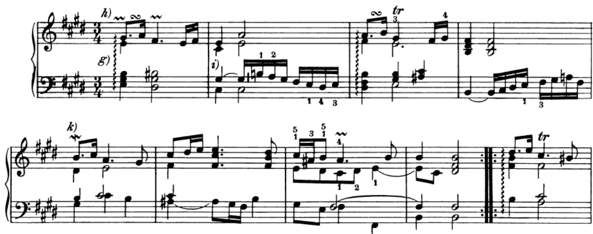
Slika 13. Sarabande iz Francuske suite br. 6, s pjevnom melodijskom linijom u gornjoj dionici i pratnjom u donjoj

Sarabande su pisali svi skladatelji baroknih suita, a najznačajniji su oni Johanna Sebastiana Bacha. U Francuskim suitama Sarabande je treći stavak.