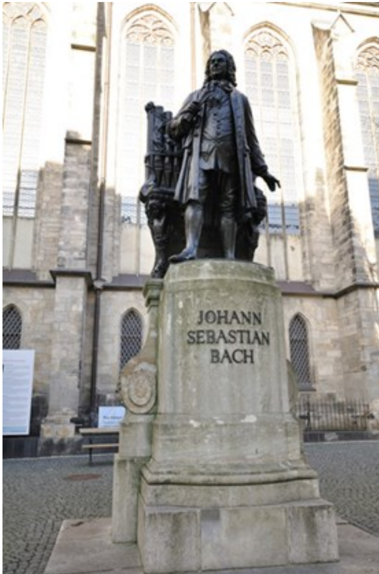
Slika 2. Bachov spomenik u Leipzigu