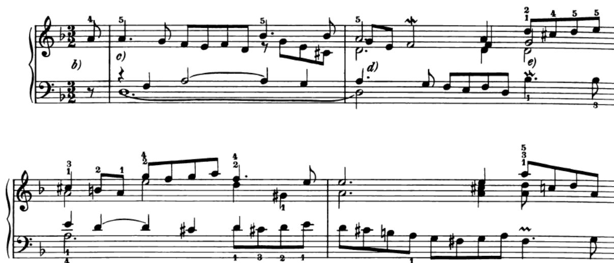
Slika 11. Courante iz Francuske suite, br. 1, primjer francuske vrste Couranta

U Bachovim djelima pojavljuju se obje vrste. U Francuskim suitama, francuskoj vrsti pripadaju Courante iz prve i treće suite, a talijanskoj vrsti pripadaju ostali (iz druge, četvrte, pete i šeste). U svim Francuskim suitama, Courante je drugi stavak, odmah nakon Allemanda .