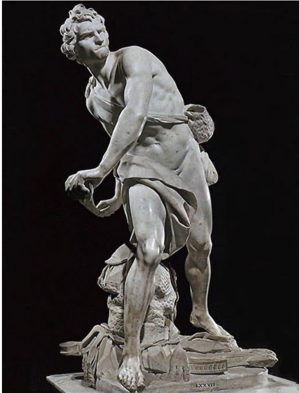
Slika 5. (gore lijevo), G. L. Bernini: David (1623.) Slika 6. (dolje desno), G. L. Bernini: Ekstaza svete Terezije (1652.)