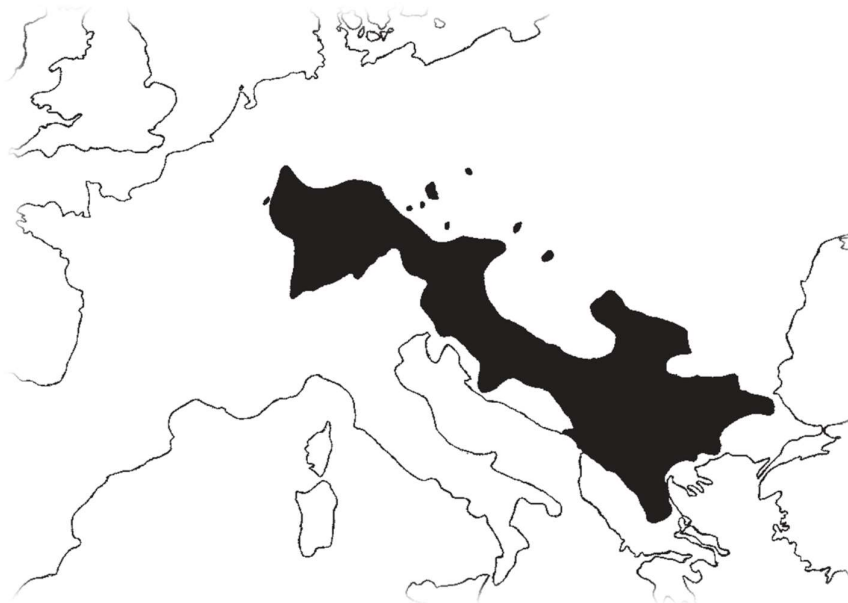
Slika 1. Rasprostranjenost vrste A. torrentium na području Europe (Machino i Füreder, 2005)