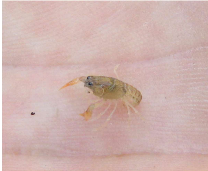
Slika 4. Tek izvaljena jedinka potočnog raka (Maguire, 2010)

manje kvalitete austrijskih staništa i smetnji u okolišu, odnosno pojačanog antropogenog pritiska na njihova staništa. Autori predlažu pojačane mjere zaštite potočnoga raka na području Austrije kako bi populacije bile izložene što manjem stresu. Hrvatske populacije većeg reprodukcijskog potencijala žive na manje poremećenim staništima, stoga se moraju poduzeti mjere zaštite koje će ih zadržati na stabilnoj razini (Maguire i sur., 2010).