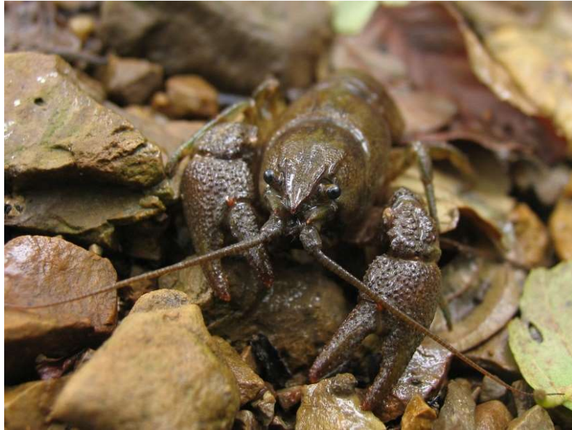
Slika 3. Vrsta Austropotamobius torrentium na kamenitom dnu ( www.freenatureimages.eu )