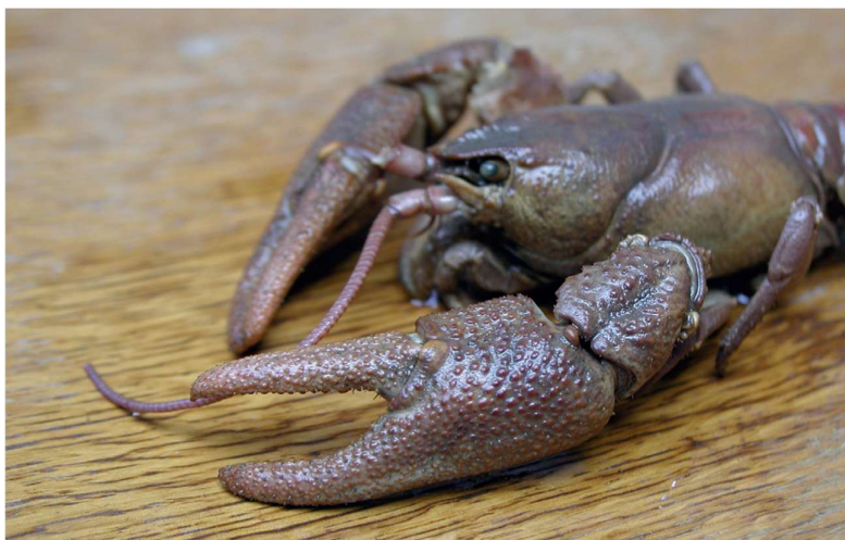
Slika 2. Detalj kliješta potočnoga raka (Maguire, 2010)