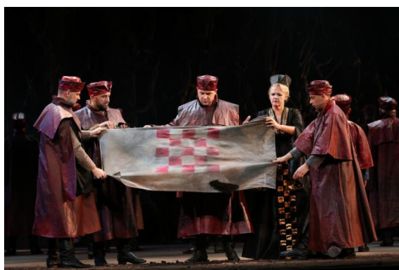
Slika VII i VIII: Opera Nikola Šubić Zrinski u produkciji HNK Ivana pl. Zajca u Rijeci

Osjećaj da sam dio nečeg velikog, ne samo tada na pozornici, već hrvatske povijesti, osjećaj ponosa što sam dio naroda koji se uvijek borio za spas svoje zemlje i mnogo drugih misli u tom su se trenutku sjedinili s glazbom i učinile taj trenutak nezaboravnim. Nadam se da će Zrinjski biti junak koji će me još dugo pratiti tijekom karijere koja je počela upravo operom koja nosi njegovo ime.