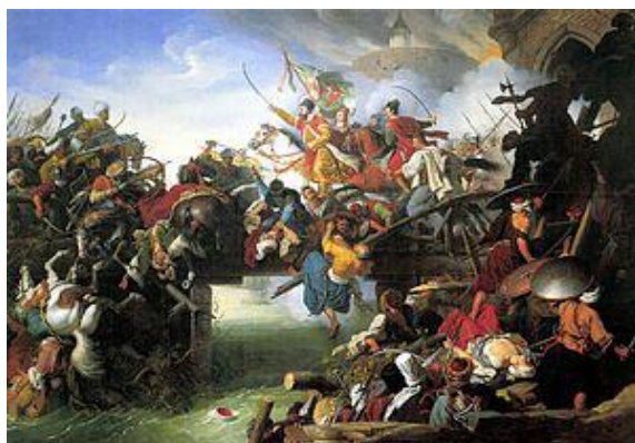
Slika II: Prikaz bitke kod Sigeta

Kobnoga 7. rujna 1566. vezir Sokolović odlučio je krenuti na sve ili ništa. Njegov je cilj bio osvajanje Beča, do kojega nikada neće uspjeti doći, ako mu pod Sigetom svakodnevno gine veliki broj vojnika. Zbog toga je odlučio topništvom razoriti grad i branitelje prisiliti na predaju. Kada je vidio da nema izlaza, Nikola Šubić Zrinski odlučio je krenuti u proboj predvodeći svoju malobrojnu vojsku. (slika 2.) 10