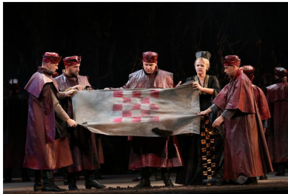
Slika VII i VIII: Opera Nikola Šubić Zrinski u produkciji HNK Ivana pl. Zajca u Rijeci

Osjećaj da sam dio nečeg velikog, ne samo tada na pozornici, već hrvatske povijesti, osjećaj ponosa što sam dio naroda koji se uvijek borio za spas svoje zemlje i mnogo drugih misli u tom su se trenutku sjedinili s glazbom i učinile taj trenutak nezaboravnim. Nadam se da će Zrinjski biti junak koji će me još dugo pratiti tijekom karijere koja je počela upravo operom koja nosi njegovo ime.