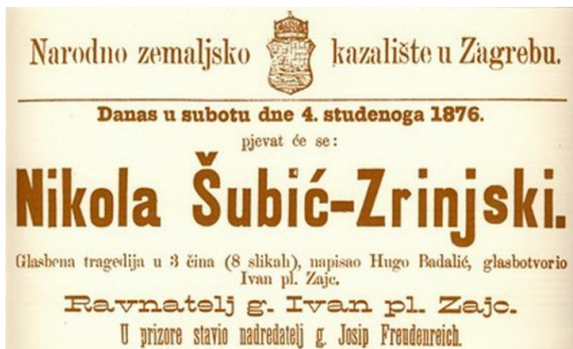
Slika IV: Slika plakata s praiizvedbe opere Nikola Šubić Zrinjski 1876. godine