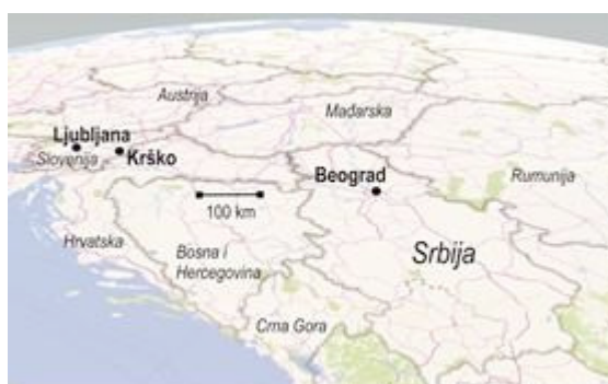
Slika 1. Merne lokacije

Ova tri merna mesta imaju slične umereno kontinentalne klime. Beograd je prosečno topliji (sa srednjom godišnjom temperaturom od 11,7 °C) od Krška (10,9 °C) i Ljubljane (9,8 °C). Najtopliji mesec je jul, najhladniji januar. Slično, na sve tri lokacije, mesec sa najvećom količinom padavina je jun, a najsuvlji mesec je februar. Sa druge strane, godišnja prosečna količina padavina u Beogradu iznosi 670 mm, a u Ljubljani 1400 mm i Krškom 1057 mm.