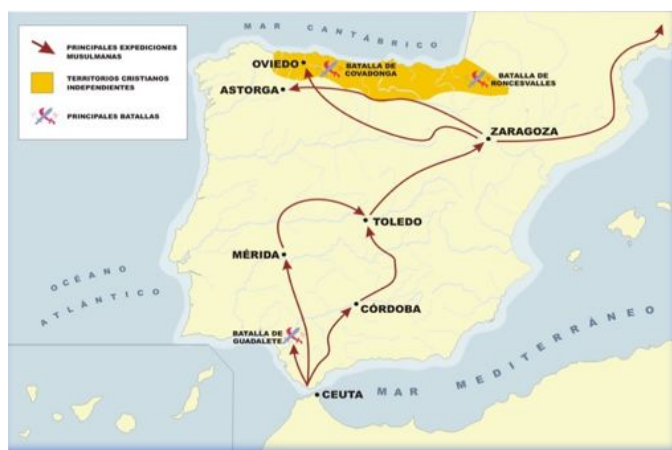
FIGURA 1: Mapa de la expansión musulmana en la Península Ibérica, siglo VIII