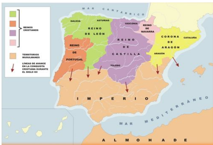
FIGURA 2: Mapa de la expansión de los reinos cristianos durante la Reconquista, siglo XII