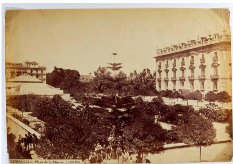
Imagen 1. Vista de la Plaza de la Aduana con la carpa del Teatro Circo Español a la izquierda