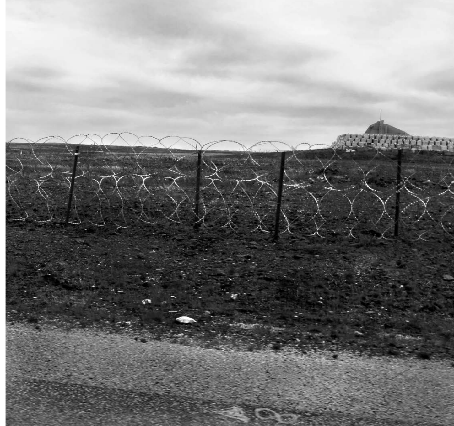
Base Militar Mount Pleasant