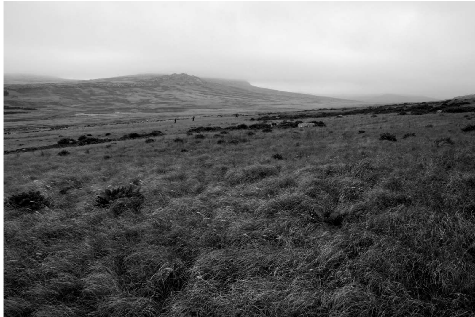
Izq. Resto de trincheras en Monte Longdon