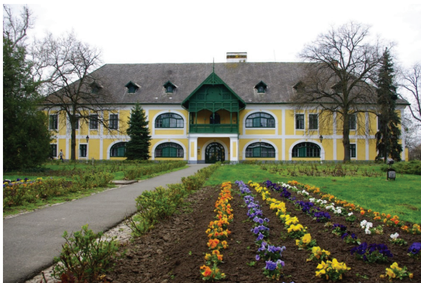
Az igazgatóság épülete, 1999.

vizsgálat rávilágíthat arra is, hogy miként tudott fennmaradni a szovjet típusú rendszerben – annak az „ancien régime”-mel és annak értelmiségével szemben tanúsított élesen elutasító viszonyulása ellenére – az a magasszintű szakmai és tudományos munka, mely a magyar agrárértelmiség-képzést egyébként a 19. század eleji kezdetektől jellemezte. Egy másik lehetséges kutatói program lehet annak a vizsgálata – mutatott rá például Gunst Péter is több írásában – hogy a nagybirtokrendszer 1945-ös megszűnésével kaptak-e új funkciókat az állami gazdaságok. Egyáltalán: tekinthetők-e az egyházi és magánbirtokok sajátos, szocialista utódjainak a magyarországi szovhozok ?