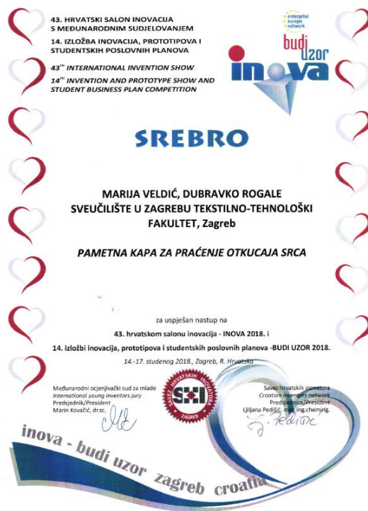
Sl. 2 Srebrna medalja sa INOVA 2018

mjeri refleksiju. Na temelju razlika u refleksiji tkiva može se određivati puls srca. Komunikacijska tehnologija predstavlja vrlo važan element pametne odjeće. U realizaciji ovog rada komunikacija se odvija unutar pametnog odjevnog predmeta (komunikacija između ugrađenih komponenti) te između pametnog odjevnog predmeta i nositelja tog odjevnog predmeta (preko mikroročunala i zaslona pametnog telefona). Ugradnjom gradbenih elemenata u kapu te mogućnost lakog postavljanja senzora na ušnu resicu prate se varijacije u svjetlosnom intenzitetu zbog promjene volumena prouzrokovan prolaskom krvi kroz područje mjerenja. Stoga izrađeni prototip pametne kape omogućava nesmetano praćenje otkucaja srčanog pulsa putem aplikacije na pametnom telefonu [5].