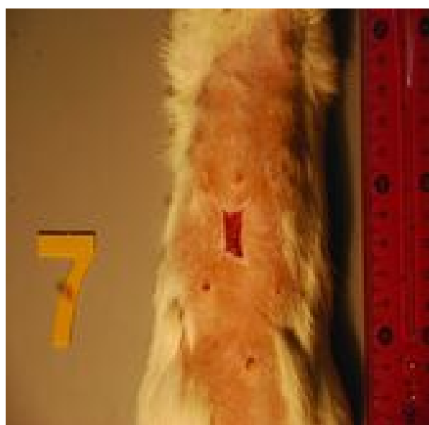
شکل ۳: زخم در روز پانزدهم در گروه آمنیون آسلولار با سلول بنیادی