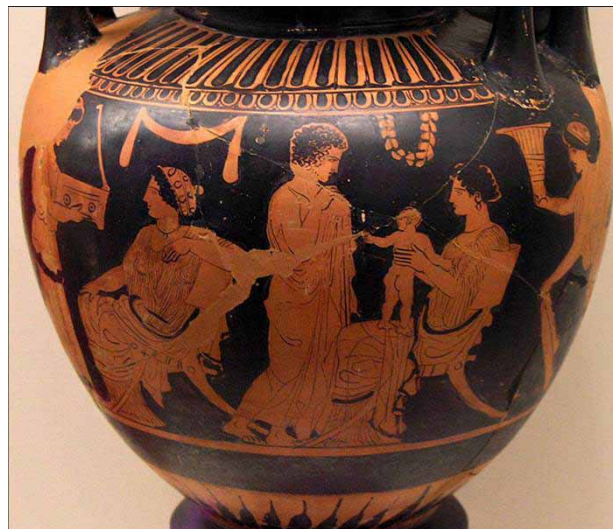
Obrázek 7. Detail lebes gamikos, okruh Neapolského maliara, okolo 430 p. n. l.

Vázové maliarstvo a funerálna skulptúra klasického Grécka nám podávajú mnohé obrazy žien, ktoré je zložitá interpretovať bez zamerania sa na širšie spoločenské, kultúrne i ekonomické kontexty. Je jednoduché vidieť v týchto zobrazeniach ženy vylúčené z verejného a politického života, úplne podriadené mužom, len na základe ich zasadenia do vnútorných priestorov domov, v ktorých sú zaneprázdnené „ženskými“ činnosťami ako pradenie, tkanie, staranie sa o deti, venovanie sa vlastnej toalete a podobne. Grécka slovo oikos , však nevyjadruje len domácnosť, rodinu, jej príslušníkov, ale všetky jej súčasti, všetko čo sa v ňom vyprodukovalo i spotrebovalo. Oikos