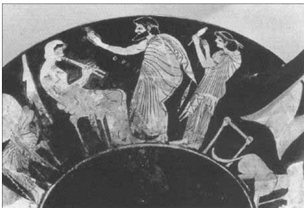
Obrázek 5. Deatail kylyxu, Ambrosiov maliar, okolo 425 p. n. l.

Interpretácia scén, zobrazujúcich textilnú produkciu, je často založená (popri literárnych prameňov) i na výsledkoch skúmania klasických gréckych domov. Podľa zaužívaných teórií bol tradičný dom rozdelený na mužskú – andron a ženskú časť– gynaikieion . Ženy nemali mať prístup ani do mužskej časti domu, ale ani do spoloč-