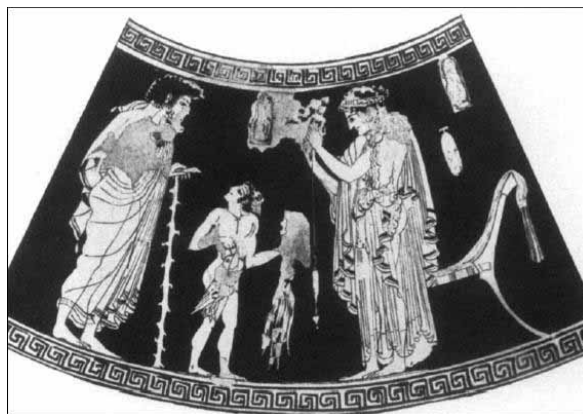
Obrázek 3. Detail alabastronu, pravdepodobne stéla s hetérou, okolo 510 p. n. l.

Podobná scéna je i na alabastrone signovanom Maliarom Pana, datovanom do rokov 475 – 460 p. n. l. (obr.4) Sediaca žena pradiť a pristupuje k nej muž opretý o palicu, ktorý jej podáva mešec s peniazmi. Beazly