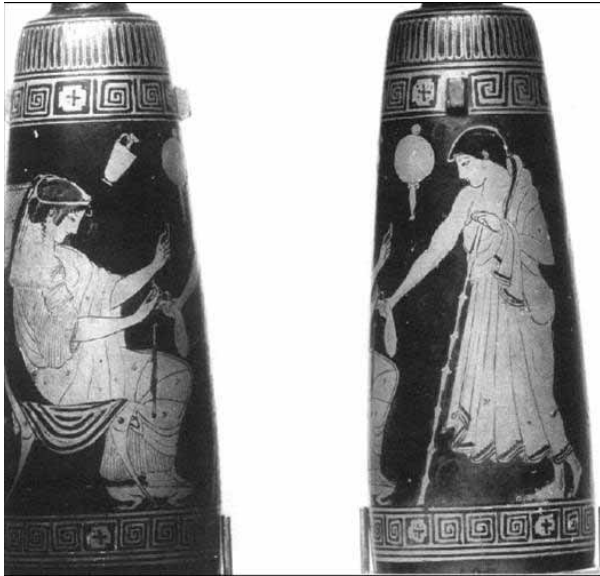
Obrázek 4. Hetéra (priadka) a jej zákazník, Maliar Pana, okolo 470 p. n. l.