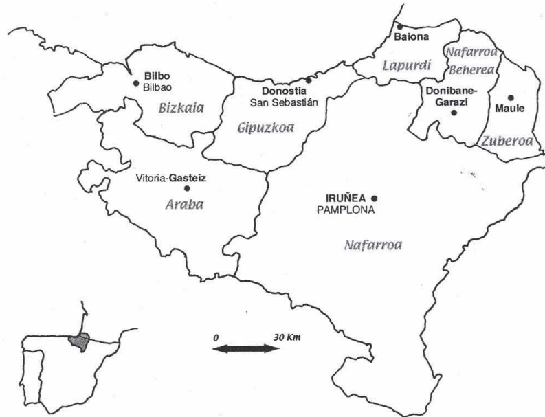
Obrázek 1. Schematická mapa Baskicka (Knörr de Santiago 2007:10)