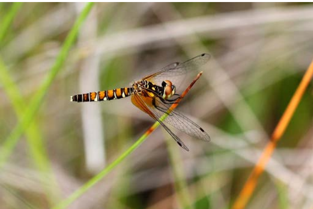
図 25 万博公園北の池のハッチョウトンボ(5月28日)