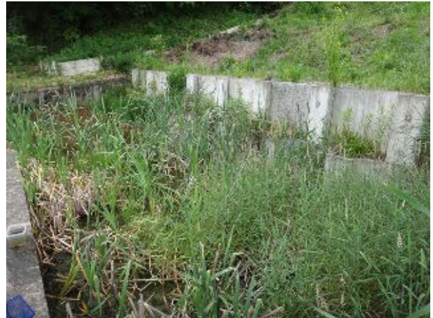
図 5 大学南の池