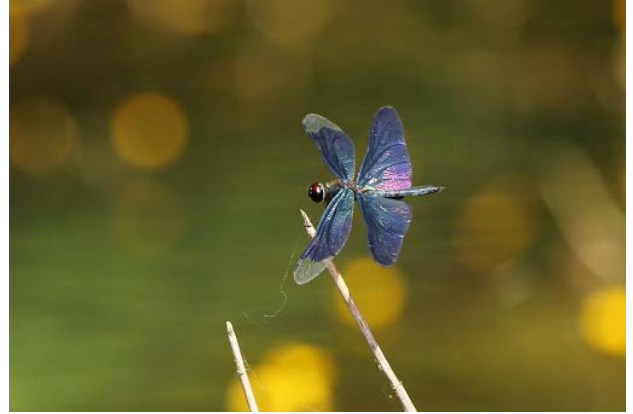
図 19 万博公園北の池のチョウトンボ(7月31日)