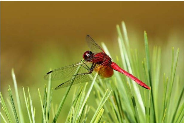
図 24 万博公園北の池のネキトンボ(10月16日)