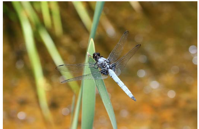
図 29 大学南の池のオオシオカラトンボ(6月26日)