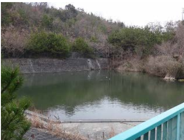
図 3 大学西の池