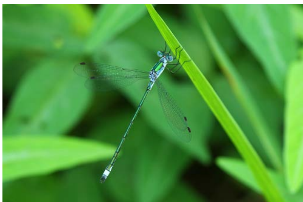
図9 椀貸池のアオイトトンボ(7月31日)