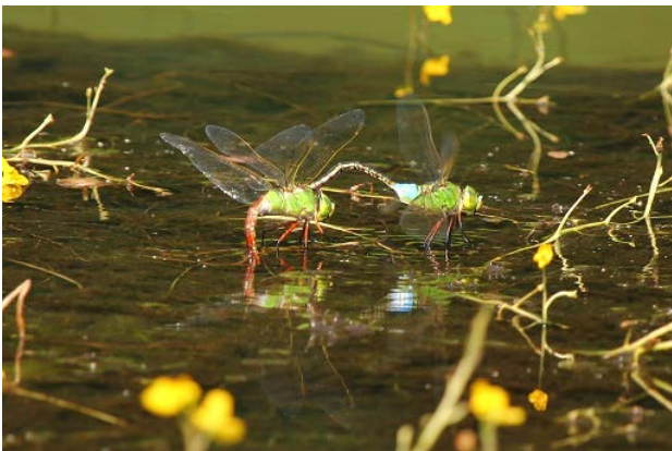
図 16 万博公園北の池のギンヤンマ(7月31日)