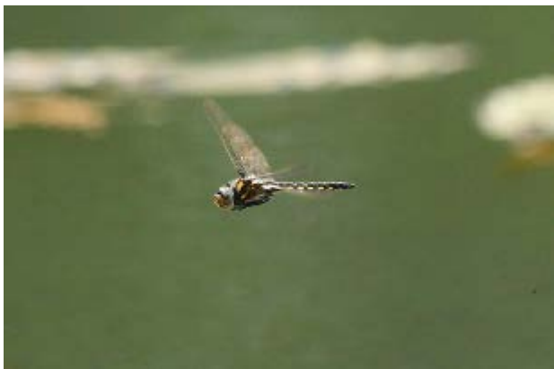
図 18 万博公園北の池のトラフトンボ(4月23日)