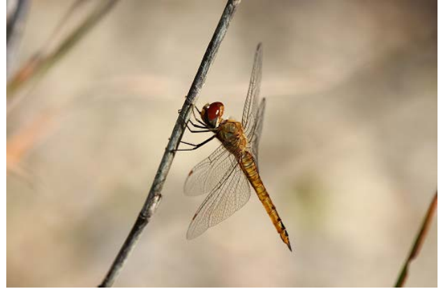
図 27 万博公園北の池のウスバキトンボ(10月16日)