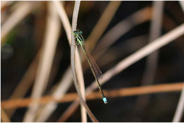
図 15 万博公園北の池のアジアイトトンボ(6月26日)