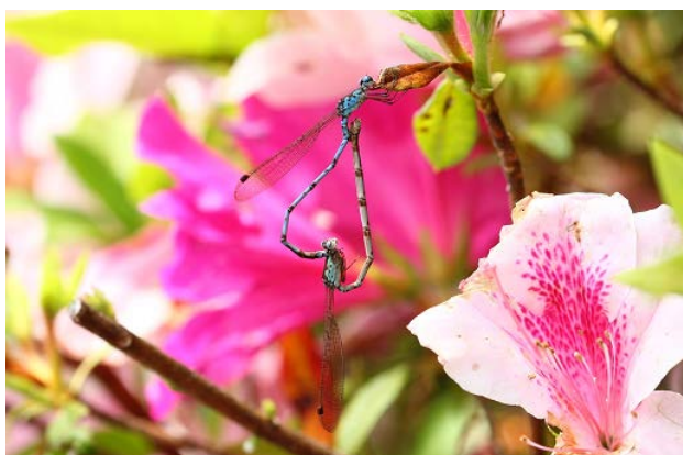
図8 大学内の池のホソミオツネントンボ(5月2日)