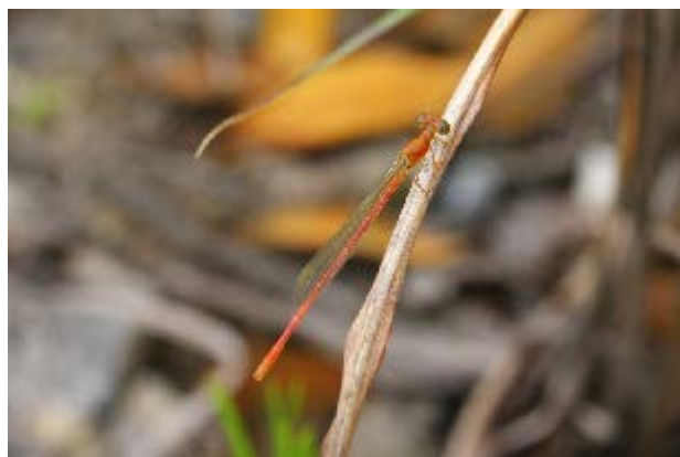
図13 万博公園北の池のベニイトトンボ(5月28日)