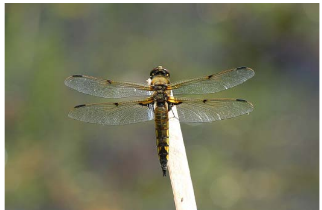
図 30 大学南の池のヨツボシトンボ(5月2日)