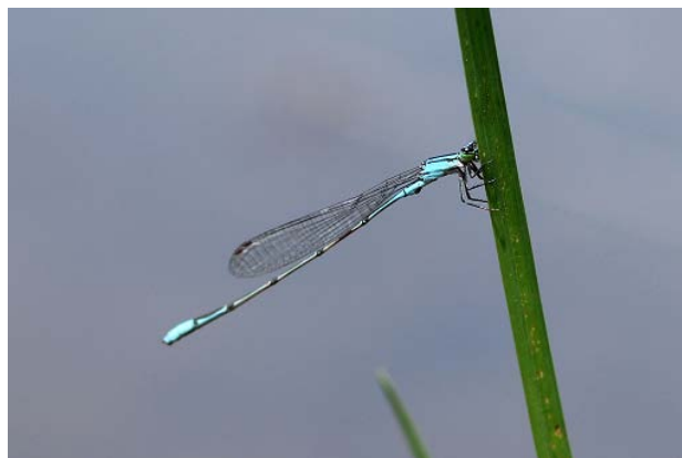
図14 万博公園北の池のホソミイトトンボ(5月2日)