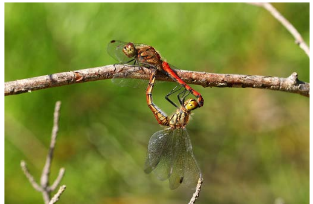
図 20 万博公園北の池のアキアカネ(10月16日)