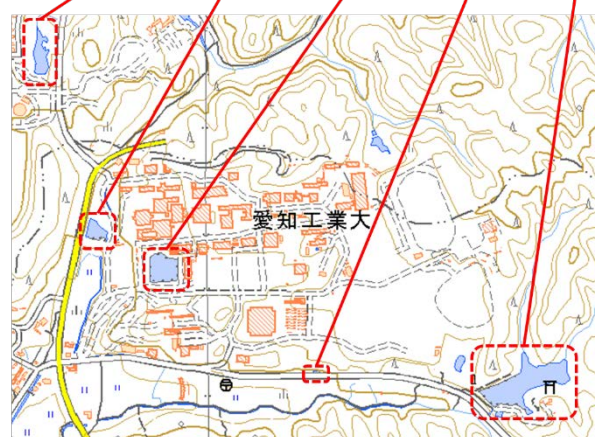
図 1 調査場所 (国土地理院の電子国土 Web より)