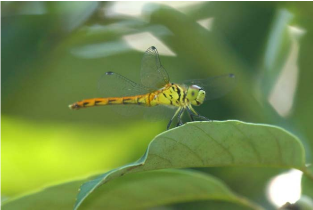
図 23 椀貸池のマイコアカネ(7月31日)