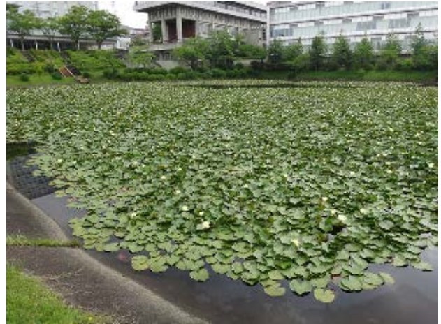
図 4 大学内の池

調査場所は、愛知工業大学八草キャンパス内とその周辺の 5 つの池である (図 1)。詳細は以下の通りである。