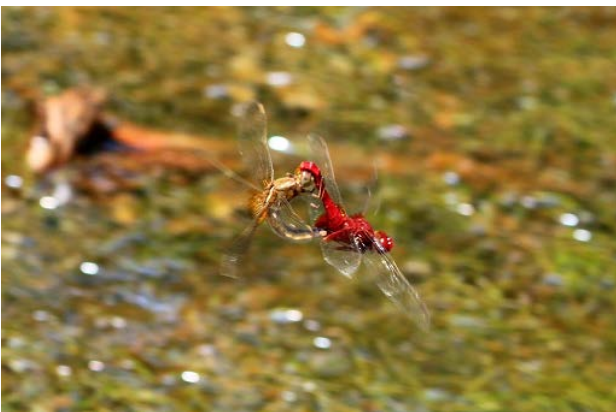
図 26 大学南の池のショウジョウトンボ(6月26日)