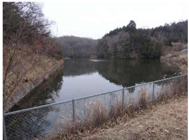
図 6 椀貸池