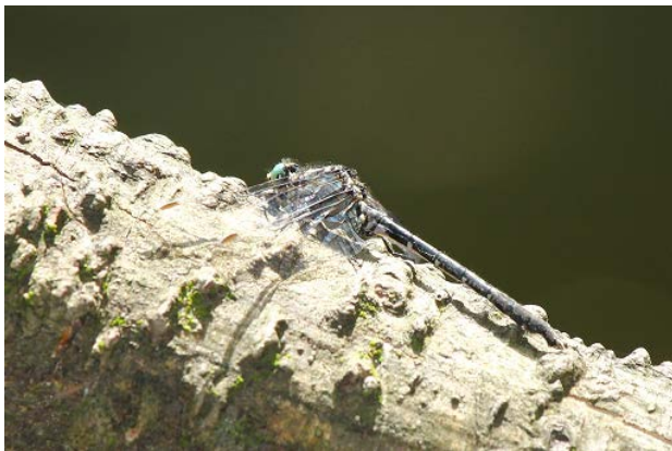
図 17 椀貸池のオグマサナエ(5月2日)