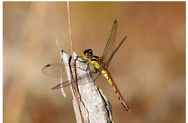
図 21 万博公園北の池のヒメアカネ(10月16日)