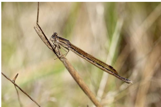
図7 万博公園北の池のオツネントンボ(5月2日)