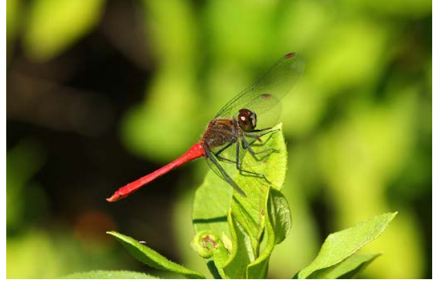
図 22 大学内の池のマユタテアカネ(10月16日)