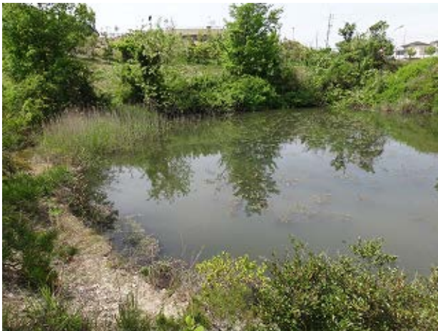
図 2 万博公園北の池