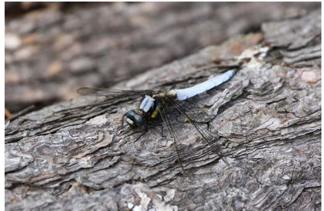
図 28 万博公園北の池のシオヤトンボ(4月23日)