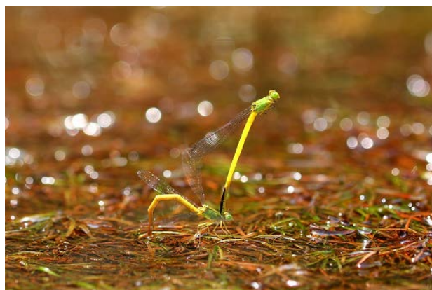
図12 大学南の池のキイトンボ(6月26日)