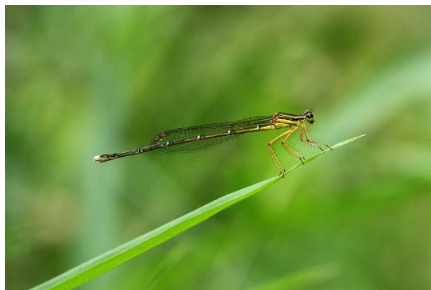
図11 椀貸池のモノサシトンボ(5月28日)