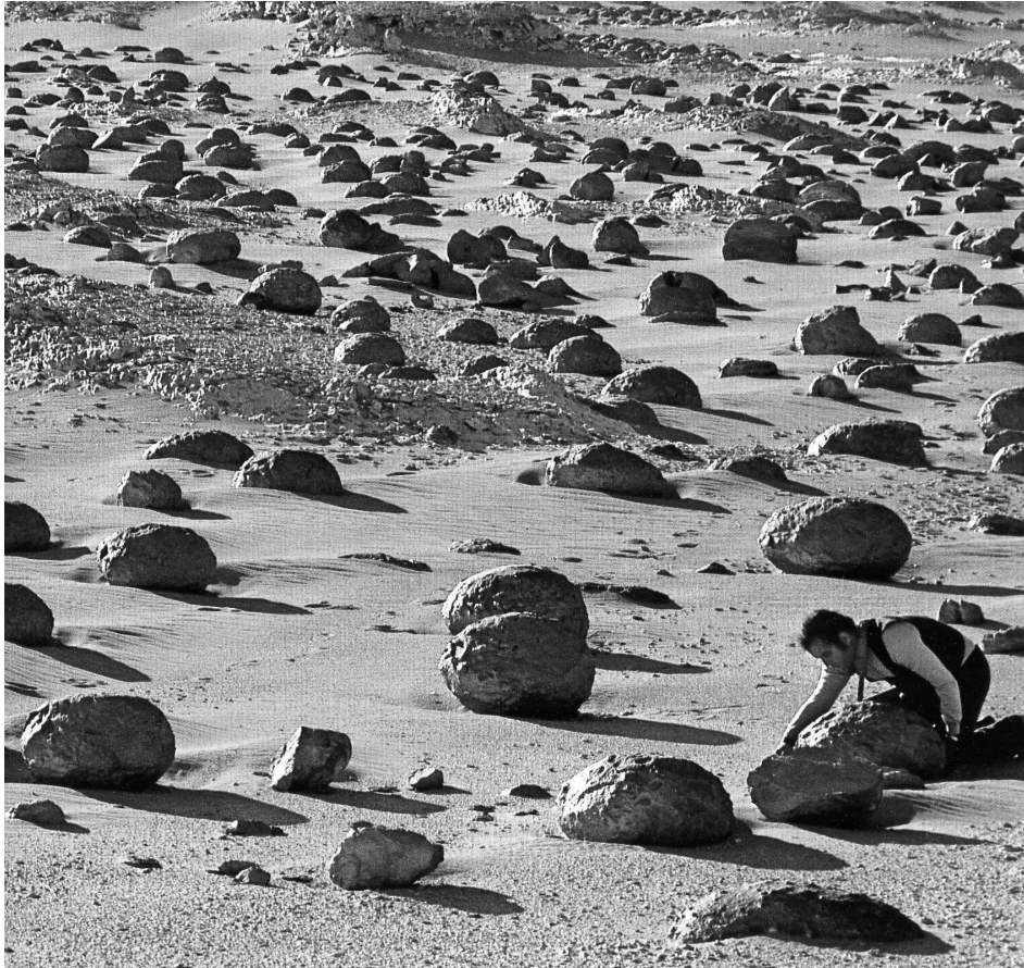
1. ábra Kövek a sivatagban

(vagy nagyon korlátozott) a felszíni és felszín alatti vízkészlet; az, hogy nincs (vagy meg-megszakított) talajképződés.