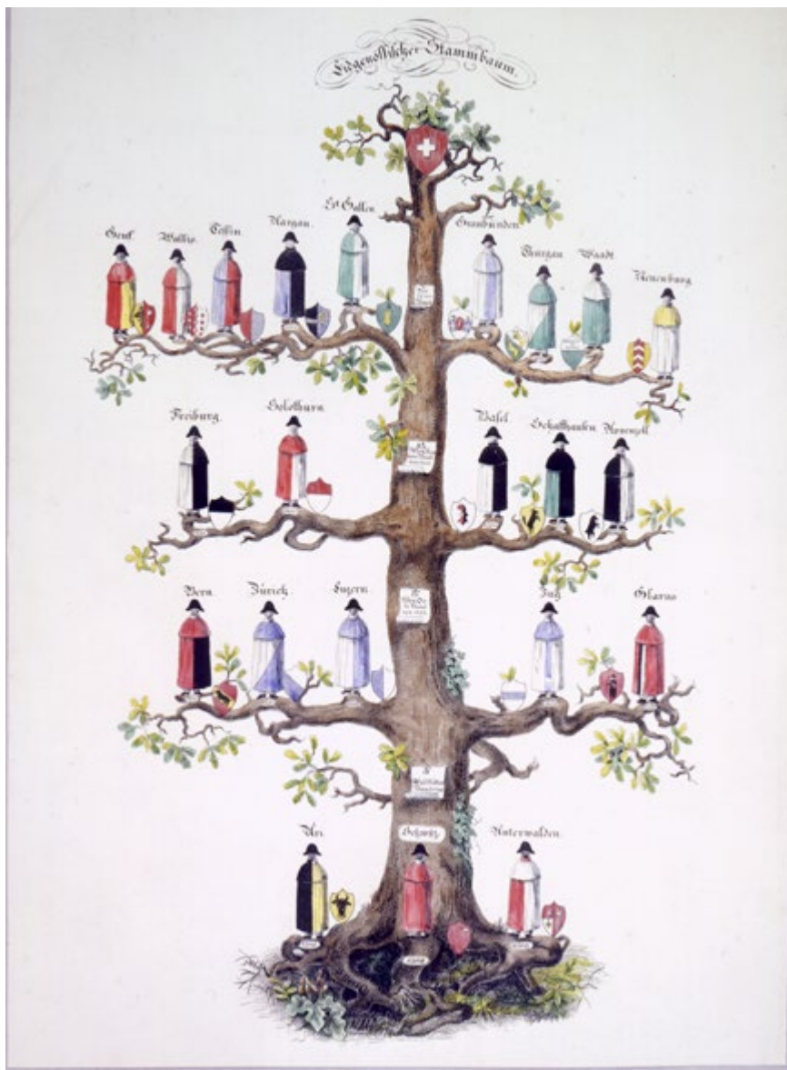
Abb. 1: Das Bild von der Eidgenossenschaft als mächtiger Eiche suggerierte die Vorstellung, die ersten sog. Bünde stellten gleichsam die Wurzeln eines mächtigen Baums Eidgenossenschaft dar, der sich von Anfang an notwendig zum Schweizerischen Bundesstaat des 19. Jahrhunderts habe entwickeln müssen. Anonym, Der eidgenössische Stammbaum , Mitte 19. Jh., ZHB Luzern Sondersammlung (Original vermisst).