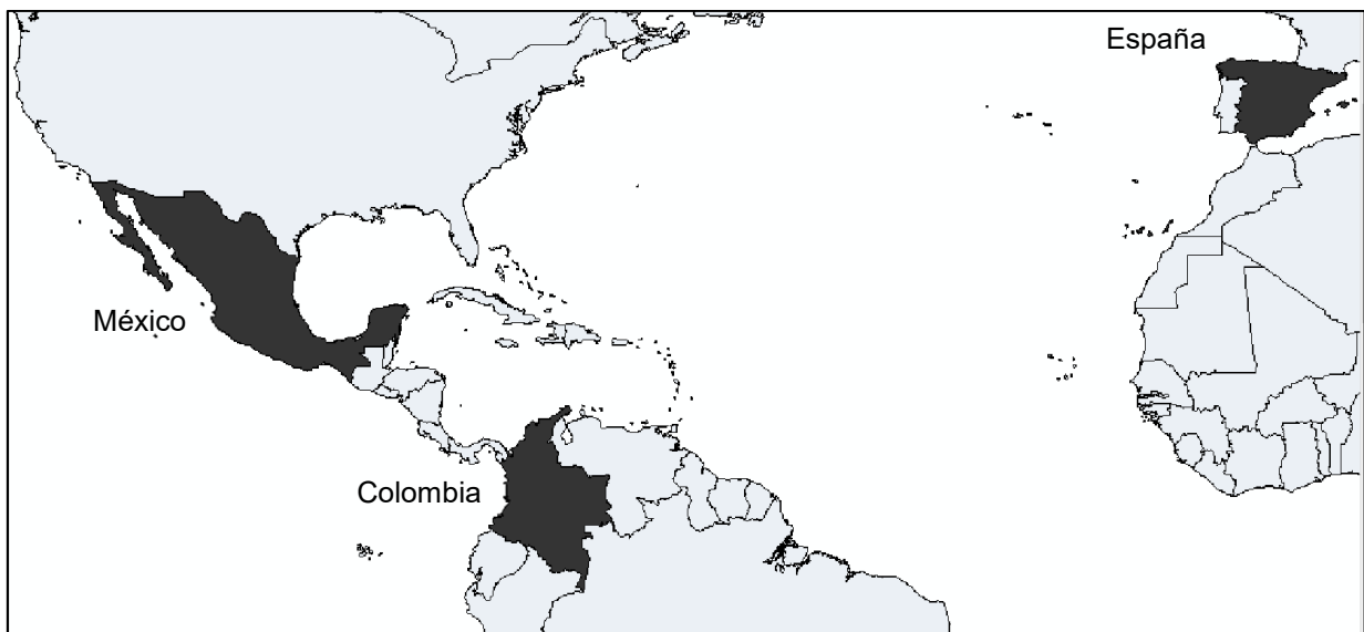
Figura 2. Ubicación Geográfica de los países de los cuales se seleccionó lo artículos en estudio