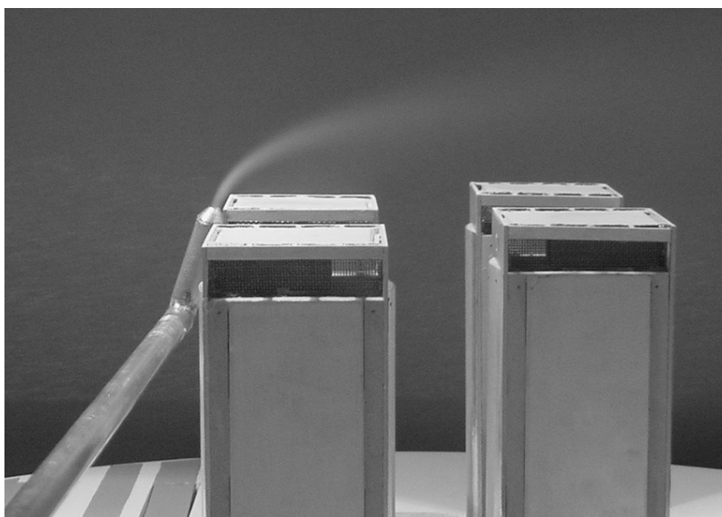
Fig. 2: Visualización de las regiones del escurrimiento

En la figura 3 es posible visualizar el proceso de dispersión de una fuente de altura similar a la de los edificios. Las velocidades medias del viento incidente son inferiores a 3 m/s y el tiempo de exposición al tomar la fotografía es muy pequeño. Esto permite analizar cualitativamente la dispersión de gases en zonas próximas a edificios donde la turbulencia generada por ellos es preponderante en el fenómeno.