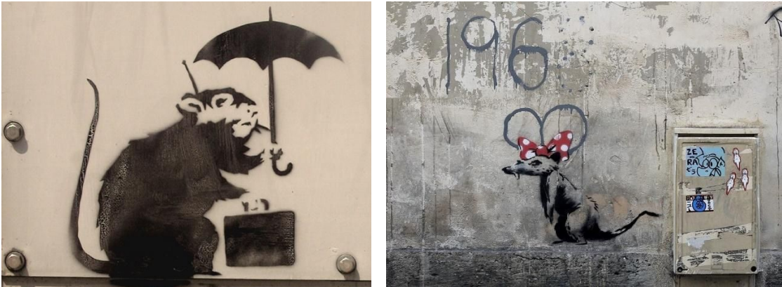
Stencil sobre pared realizado en las calles de Camden, Londres y París, Francia (2016)

entendemos representa a la clase alta burguesa empresarial de Inglaterra. A través de la metáfora el artista presenta un fuerte mensaje político y crítico, sustentado en los recursos del stencil, el póster y las pegatinas.