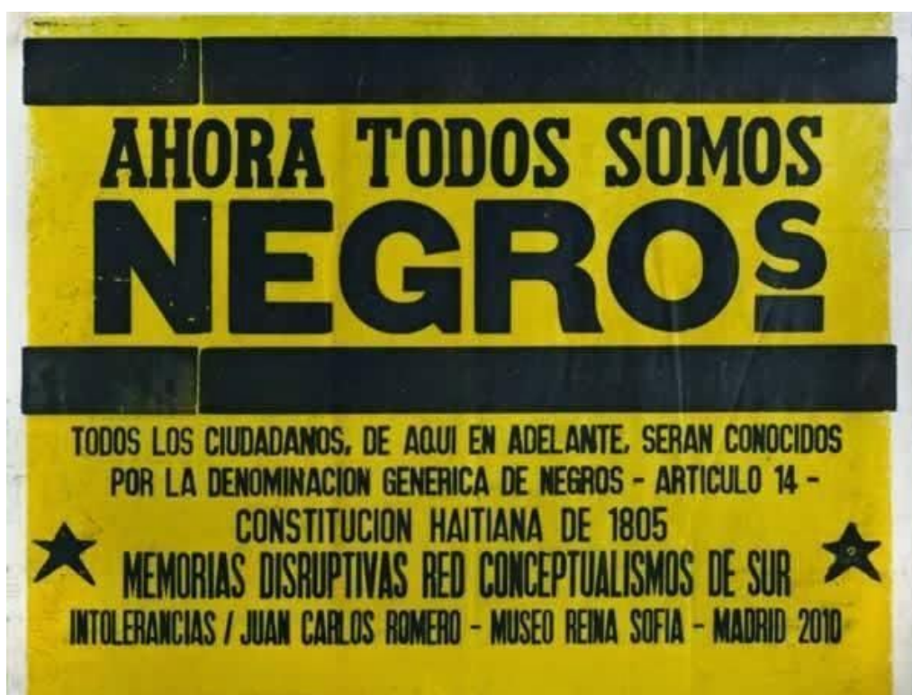
Todos Somos Negros de Carlos Romero, Intervención urbana de afiches en las calles de Madrid (2010)

También, en cuanto a la perspectiva político/crítica encontramos referentes de nuestro trabajo en la obra gráfica de Juan Carlos Romero, y de modo particular en la intervención urbana de afiches llamada Todos Somos Negros (2010) donde la repetición, encarnada en el impreso múltiple se utiliza como alternativa crítica a los postulados del circuito del arte, potenciando al extremo la situación de su recepción pública. La intervención en la esfera pública como terreno privilegiado para el debate público y la participación colectiva para un nuevo diálogo en que la cultura actúa al ritmo de la sociedad.