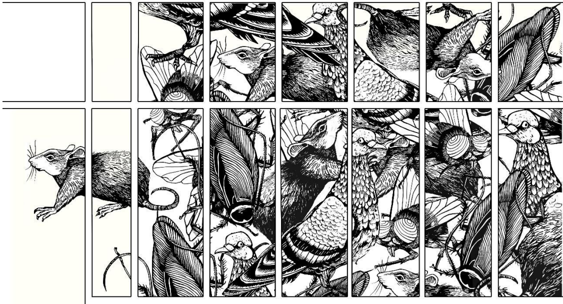
(Figura 10) Plano del emplazamiento sobre la vidriera de la Sala B del Centro de Arte