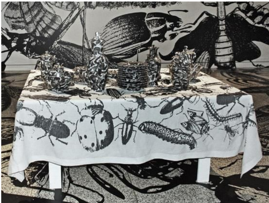
Mundus Admirabilis and Other Plagues (detalle), Regina Silveira 2008 en Moore College of Art and Design

Otra referencia significativa que alimentó el proceso de producción de esta tesis es la obra Mundus Admirabilis de la artista brasileña Regina Silveira. Quien hace una transposición a otros posibles sentidos de la significación de la plaga