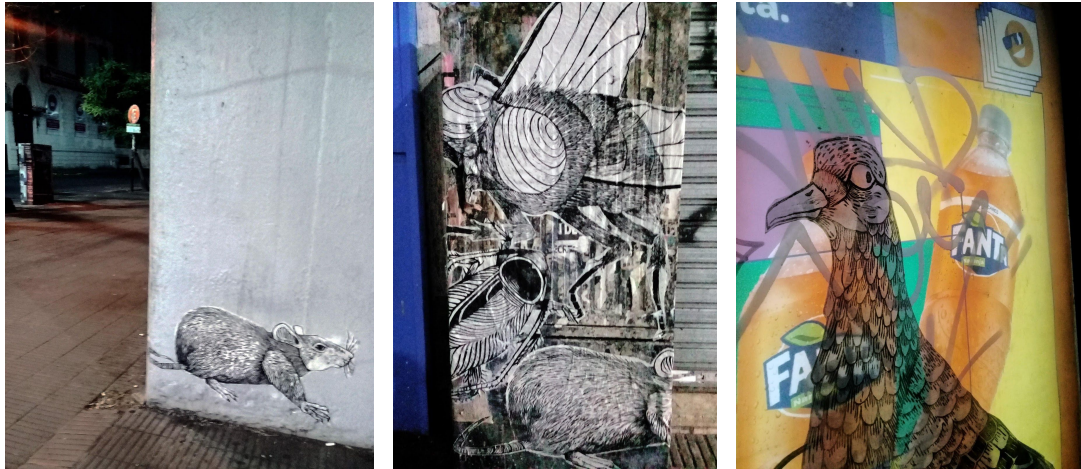
(Figura 1-3) Intervención de pegatinas en espacio público.

En virtud de lo anterior se realizaron cuatro matrices xilográficas de grandes dimensiones (1 mt x 60 cm aproximadamente) pensadas como afiches para ser emplazados en el entorno local, de manera individual como también en conjunto. Su reproducción múltiple de acuerdo al espacio a intervenir apuntó a promover interpretaciones que potencien su productividad semántica. Ya sea en edificios abandonados, obras en construcción y paredes colmadas de propaganda política o comercial (figura 1).