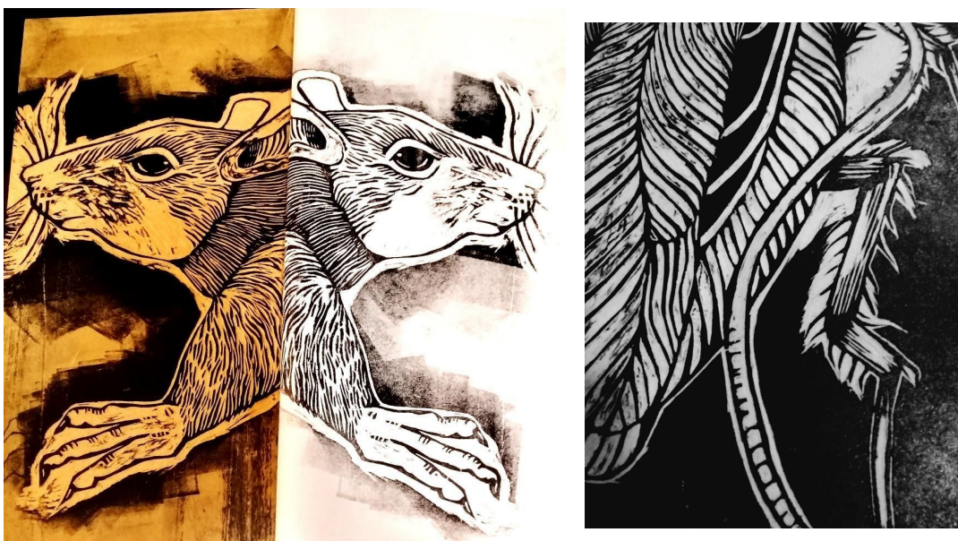
(Figura 4-5) Detalle estampa xilográfica Plaga sobre papel sulfito. Ensayo rata y fragmento cucaracha.

Por otro lado, el emplazamiento en la vía pública implicó que las imágenes funcionaran en conjunto y no de manera aislada, ya que se ve reforzada la idea de masividad. Durante el recorrido diario se puede contemplar que muchas de ellas fueron suprimidas y otras conviven con las diversas intervenciones en el espacio público.