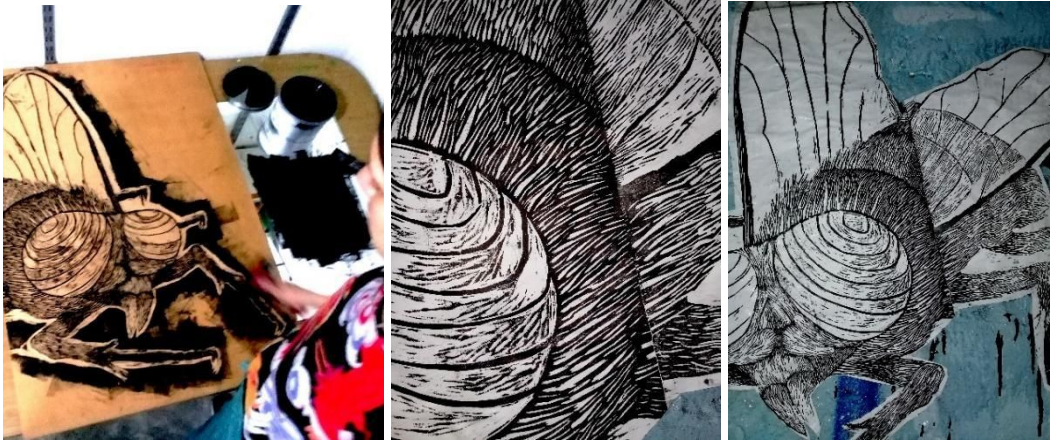
(Figura 6-7-8) Proceso de impresión de la Plaga e intervención en espacio público.

de circuitos que conviven actualmente, que primeramente fueron excluyentes y que hoy se integran con naturalidad en la experiencia del arte. Se interrogan estos espacios académicos desde el diálogo adentro-afuera , enriqueciendo la dimensión conceptual de la plaga como construcción ominosa .