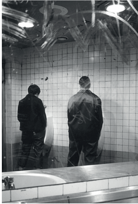
IMAGEN 1: CABELLO/CARCELLER, AUTORRETRATO COMO FUENTE , (2001) 7

de Carmela García 4 , o Autorretrato como fuente (2001) de Cabello/Carceller, las propuestas sobre urinarios de Txaro Fontalba 5 o Gender Poo (2008) de Coco Riot 6 .