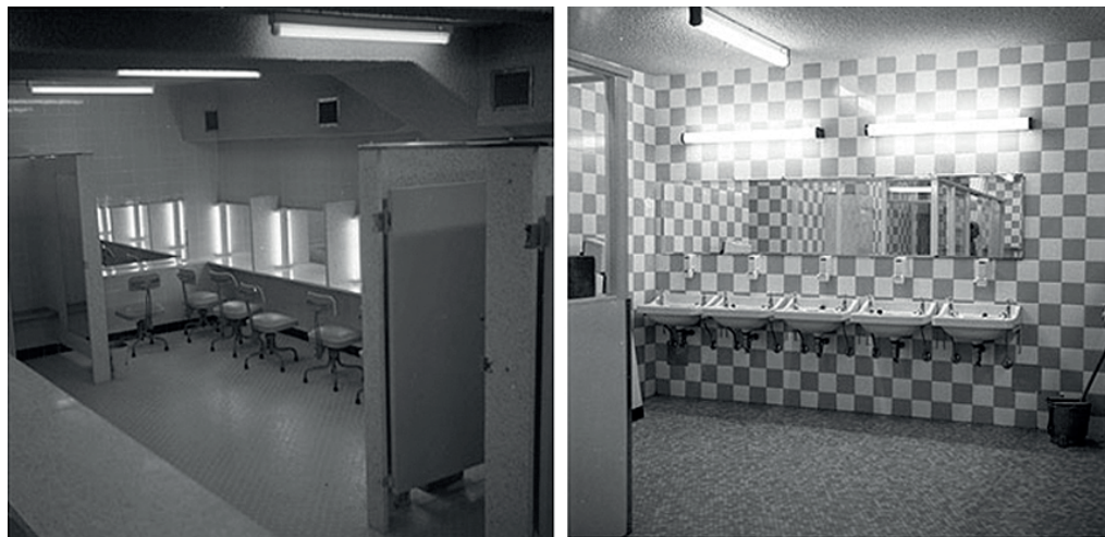
IMAGEN 3: MELBOURNE, ASEOS SUBTERRÁNEOS , (1961) 13

se constituye como una ficción en sí misma cuando hay tres espacios segregados, o como una ficción dependiente de una de las dos anteriores, generalmente asociada a la ficción “mujer”. Así, cualquier cuerpo que no se adapte a las normas, comportamientos y estrategias de representación establecidas por el orden heteropatriarcal para hombres y mujeres, y sólo para hombres y mujeres, queda imposibilitado tanto en el tránsito como en la producción, tal y como sucede con las subjetividades transexuales, queer , transgénero, intersexuales, etc. La obras Women’s bathhouse (1997) y Men’s bathhouse (1999) de Katarzyna Kozyra son claves para analizar los diferentes discursos espaciales producidos y reproducidos en las arquitecturas destinadas a mujeres y a hombres respectivamente. En sus instalaciones, en las estrategias artísticas utilizadas y en sus propias declaraciones (Blase, 1999; Zmijewski, 2004) se puede apreciar cómo el discurso heteropatriarcal atraviesa la conceptualización de cada uno de estos espacios: la hipersexualización del baño masculino frente a la desexualización del baño femenino, con la homofobia que esto implica, la seguridad patriarcal del espacio femenino, la objetualización del cuerpo de las mujeres y el concepto de lo monstruoso en referencia a aquello que difiere de la representación normativa del par hombre/mujer.