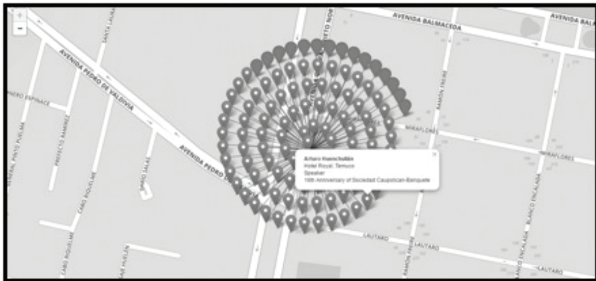
Figura 3. Resultado no publicado del proyecto “Historias interconectadas”

Otro tipo de visualización que hemos incorporado a nuestra página son diagramas (Fig. 4), las que vinculan visualmente a las personas y los encuentros. Para identificar a las perso-