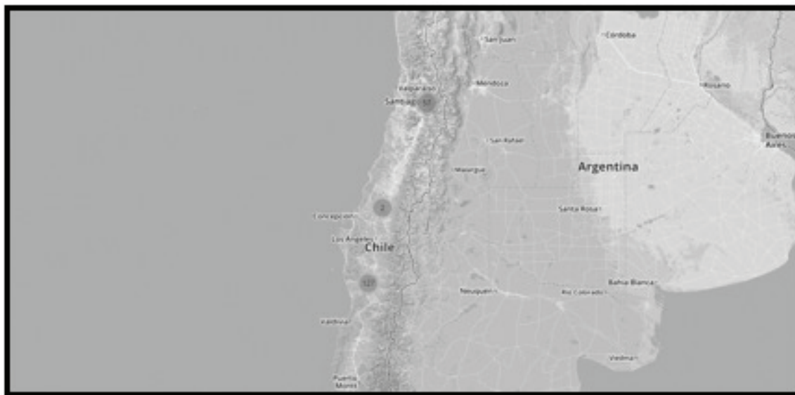
Figura 2. Resultado no publicado del proyecto “Historias interconectadas”

Los números que aparecen indican la cantidad de conexiones encontradas en cada área general del país (en el caso de Venancio Coñuepán se encuentra conexiones en México porque asistió al primer Congreso Interamericano Indigenista en Patzcuaro, México, en 1940). Si hacemos clic en uno de los círculos (Fig. 2), aparecen puntos que indican los eventos registrados y el nombre de las personas que asistieron. Como vemos en Figura 3,