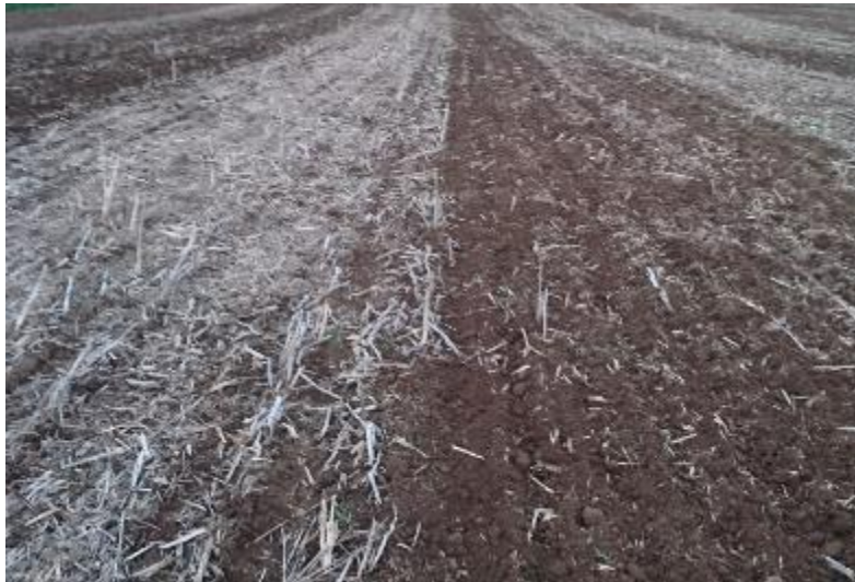
Figur 5. Obearbetat och bearbetat.