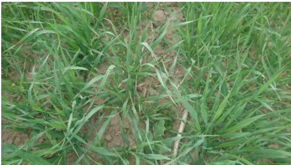
Figur 14. Bearbetat.