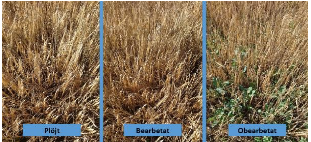
Figur 28. Provlinje 3.