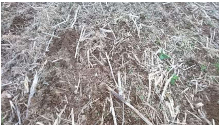
Figur 9. Närbild obearbetat.