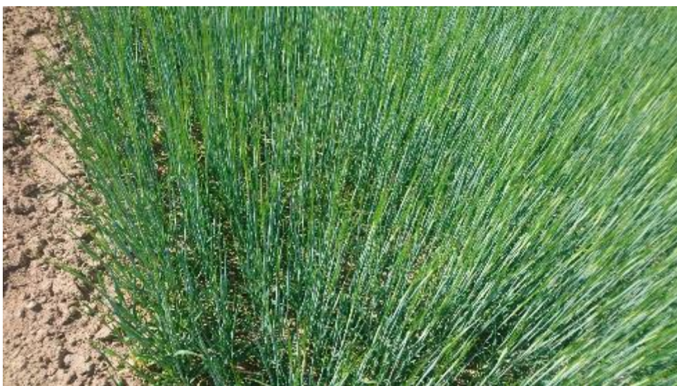
Figur 18. Plöjt.