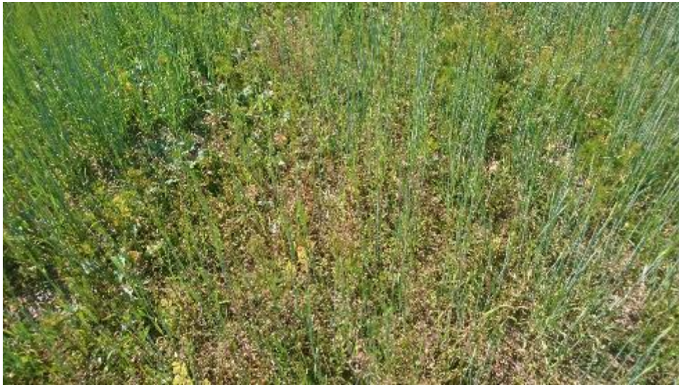
Figur 19. Obearbetat.