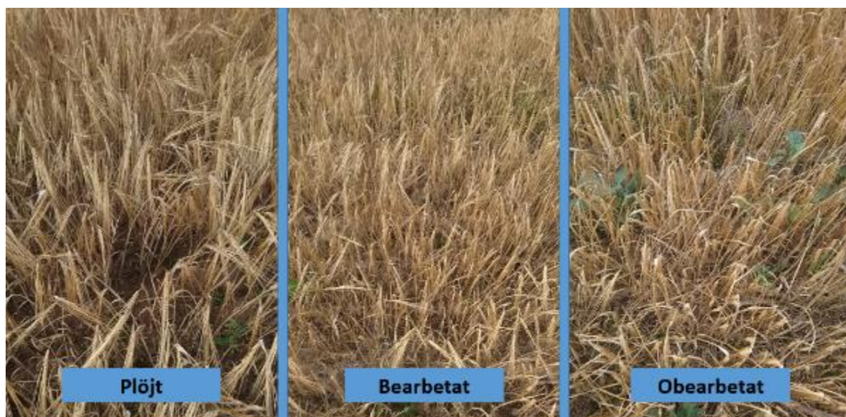
Figur 26. Provlinje 1.