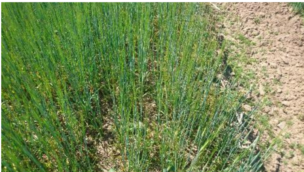
Figur 21. Bearbetat.