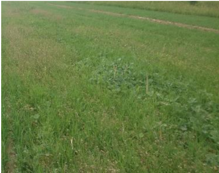
Figur 12. Obearbetat.