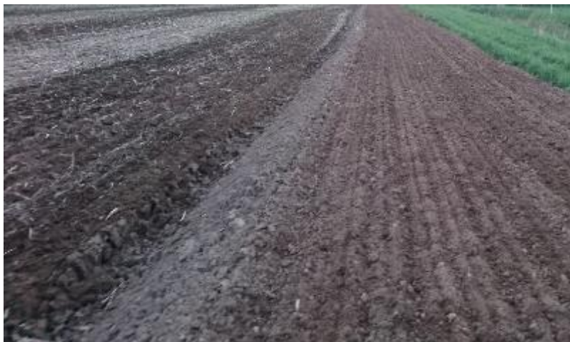
Figur 6. Bearbetat och plöjt.