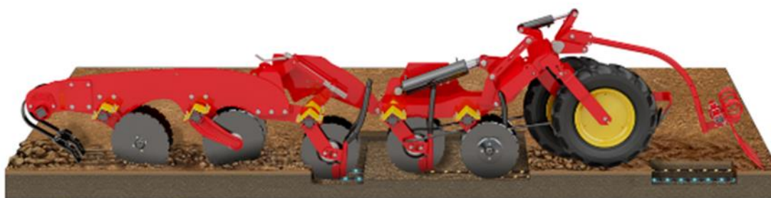
Figur 2. Illustration av Väderstad Rapid med förredskapet System Disc. (Väderstad AB u.å.c)

Under en längre tid har det funnits såmaskiner på marknaden som även klarar av att så utan förbearbetning. Ett bra exempel på en modern såmaskin är Väderstad Rapid som går att definiera som en universalsåmaskin. Om den är utrustad med förredskapet System Disc kan den bearbeta marken kraftigt innan sådd. System Disc är två rader skärande och intensivt bearbetande tallrikar som följs av en crossboard innan såbillarna. Det höga tryck som går att få på såbillarna gör att de även kan tränga ner i obearbetad mark. Enligt Väderstad AB (u.å.a) skapar Rapidens skivbill en ren såfåra utan halmstrån även om det finns mycket skörderester i ytan. Det är liknande billar för gödningen men de går djupare. Första raden är gödselbillar med radavstånd på 25 cm, sedan är det två rader med utsädesbillar med vardera radavstånd på 25 cm, vilket resulterar i 12,5 cm i radavstånd för utsädet och en rad med gödsel mellan varannan utsädesrad. Se genomskärning av såmaskinen i figur 2 (dock ligger crossboarden framför tallrikarna i illustrationen).