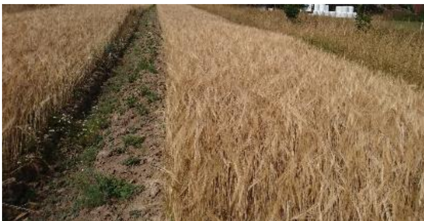
Figur 22. Plöjt.