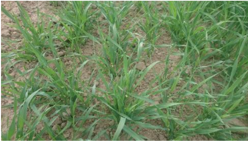
Figur 13. Plöjt.