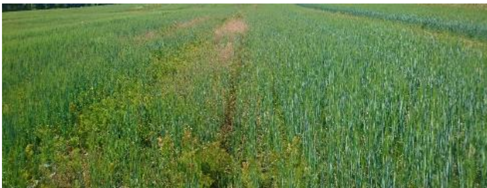
Figur 17. Obearbetat och bearbetat.