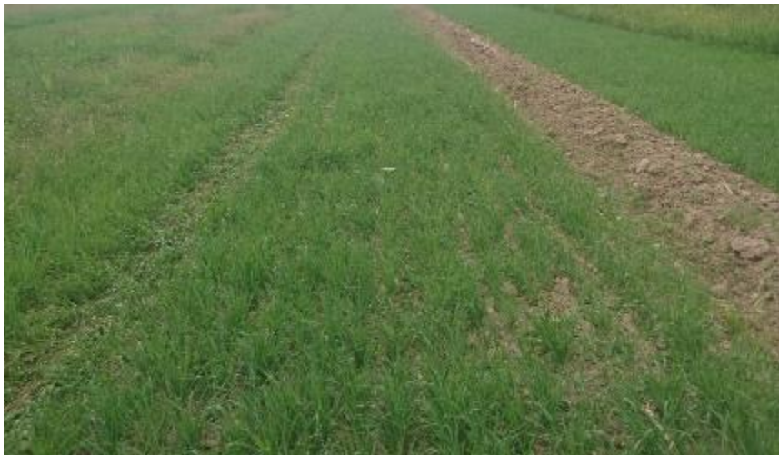
Figur 11. Bearbetat.