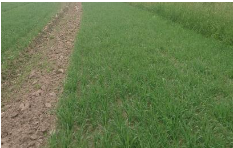
Figur 10. Plöjt.