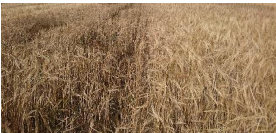
Figur 24. Obearbetat och bearbetat.