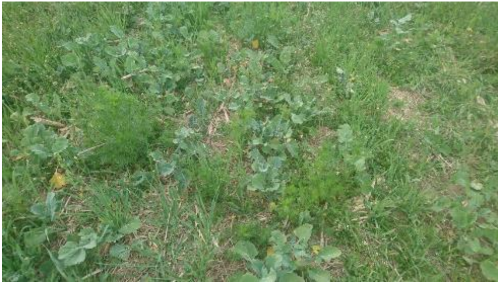
Figur 15. Obearbetat.