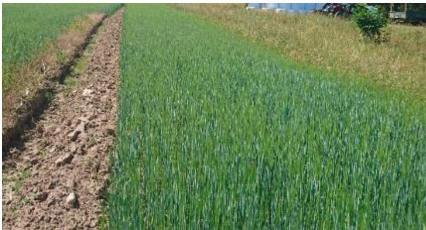
Figur 16. Plöjt.