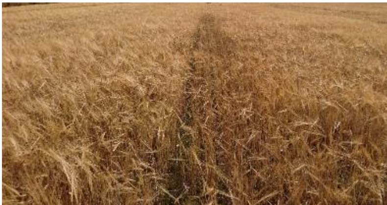
Figur 25. Bearbetat och obearbetat.