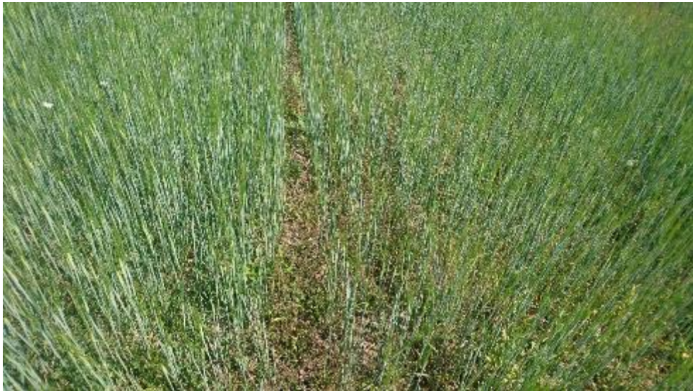
Figur 20. Bearbetat och obearbetat.