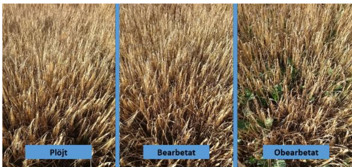
Figur 27. Provlinje 2.