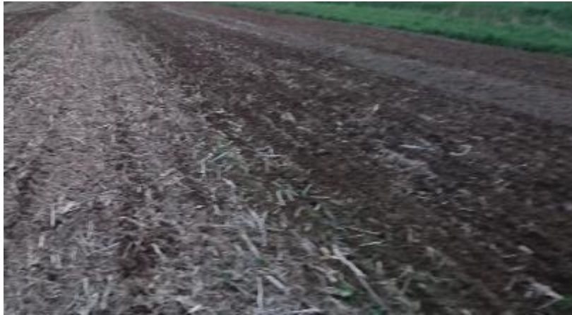
Figur 7. Obearbetat, bearbetat och plöjt.