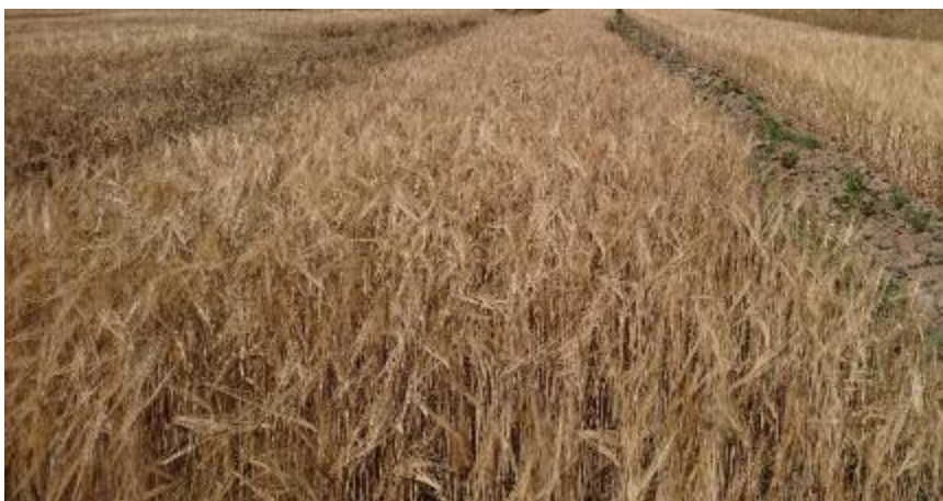
Figur 23. Bearbetat.