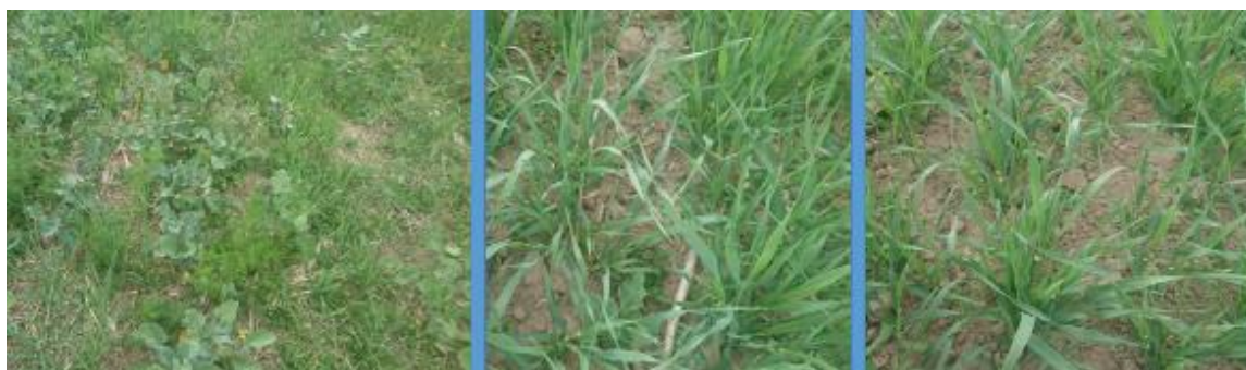
Figur 4. Foto över fältets olika behandlingar, 6 juni 2018. 27 dagar efter sådd. Från vänster: Obearbetat - Bearbetat - Plöjt.

Uppkomsten var bra och likartad mellan det bearbetade och det plöjda däremot hade det obearbetade sämre uppkomst. Det plöjda hade obefintlig ogräsförekomst fyra veckor efter sådd. I det bearbetade förekom det ogräsplantor men det var av mindre sort och kornet hade bra konkurrensförmåga. I det obearbetade hade spillrapsen tagit överhand tillsammans med några stora baldersbrå plantor. Kornet hade mycket dålig konkurrenskraft i det obearbetade. Se figur 4.