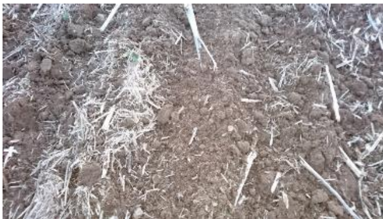
Figur 8. Närbild bearbetat.