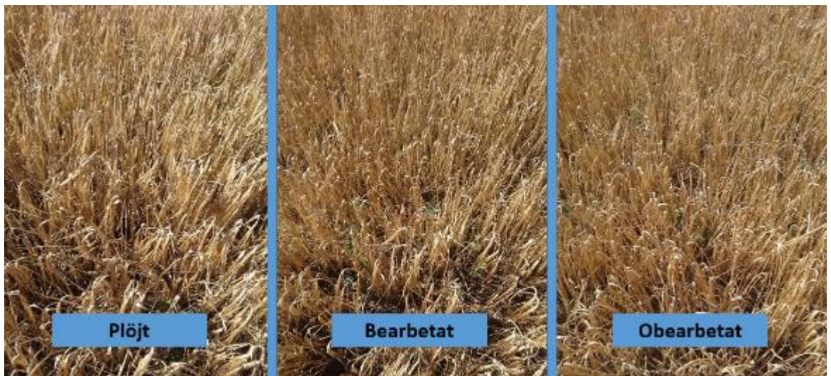
Figur 29. Provlinje 4.