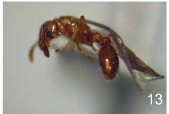
図 8-13. 8: トゲアリ Polyrhachis lamellidens F. Smith, 鳥取市久松山産 (Mt. Kyûshô, Tottori City). 9: ヒラズオオアリ Camponotus nipponicus Wheeler, 鳥取市久松山産 (Mt. Kyûshô, Tottori City). 10: ニシムネアカオオアリ Camponotus hemichlaena Yamauchi & Brown, 江府町鏡ヶ成産 (Kagamiganaru, Kôfu-cho). 11: ケブカツヤオオアリ Camponotus nipponensis Santschi, 日野町宝仏山産 (Mt. Hôbutsu, Hino-cho). 12: ウメマツアリ Vollenhovia emeryi Wheeler, 鳥取市久松山産 (Mt. Kyûshô, Tottori City). 13: ヤドリウメマツアリ Vollenhovia nipponica Kinomura & Yamauchi, 鳥取市久松山産 (Mt. Kyûshô, Tottori City).

15. Camponotus hemichlaena Yamauchi & Brown ニシムネアカオオアリ (図 10) 採集記録. 【江府町】鏡ヶ成 (大山)(2W, 5-VI-2006, TS).