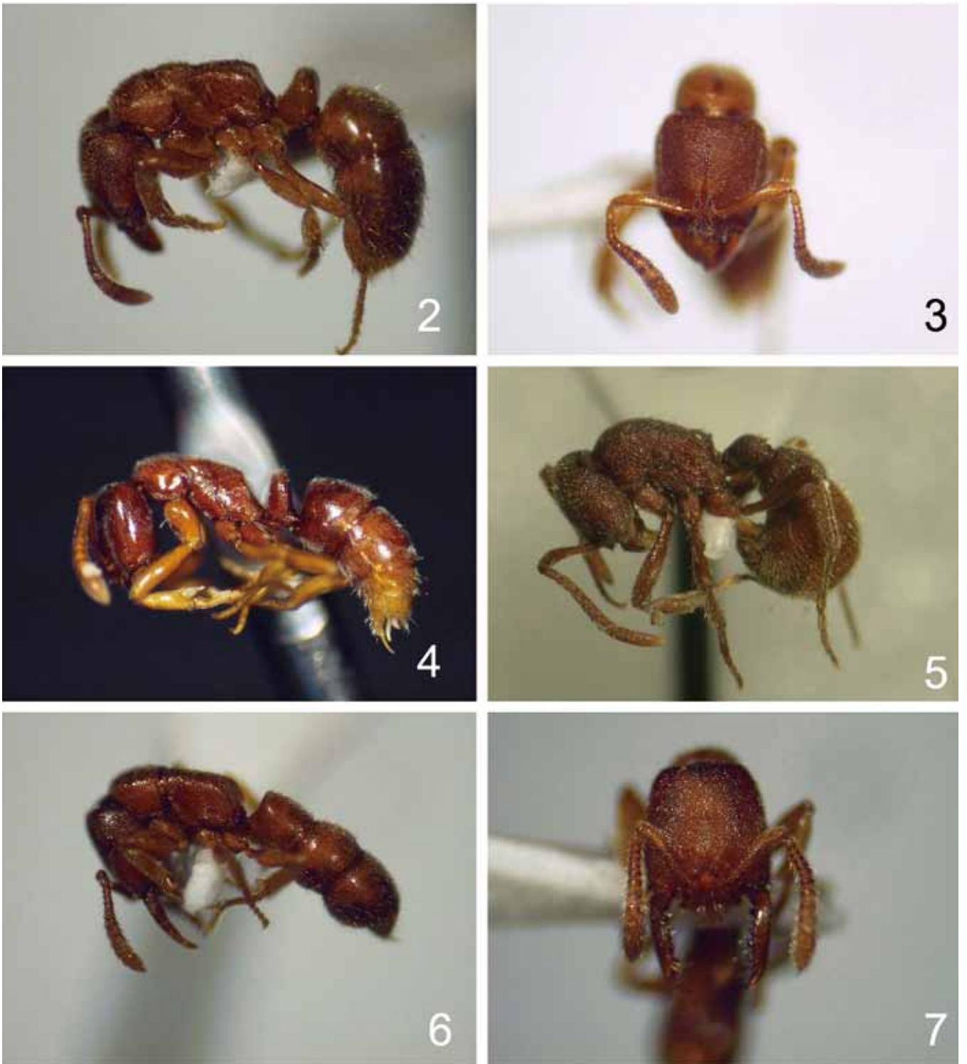
図 2-7. 2-3: トゲズネハリアリ Cryptopone sauteri (Wheeler), 岩美町荒金産 (Arakane, Iwami-cho; 3 は頭部正面). 4: ベツピンニセハリアリ Hypoponera beppin Terayama 日野町宝仏山産 (Mt. Hôbutsu, Hino-cho). 5: ワタセカギバラアリ Proceratium watasei (Wheeler), 鳥取市久松山産 (Mt. Kyûshô, Tottori City). 6-7: ノコギリハリアリ Amblyopone silvestrii (Wheeler) 鳥取市久松山産 (Mt. Kyûshô, Tottori City; 7 は頭部正面).

田神社) (1W, 3-IX-1999, TM). 【伯耆町】榎水(大山) (4W, 23-IV-2006, TS). 【江府町】鏡ヶ成 (大山) (1DF, 5-VI-2006, TS).