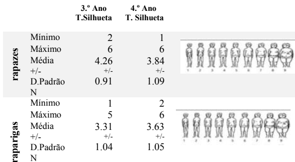
Tabela 4 – Valores obtidos Teste da Silhueta / Imagem Corporal

Analisando de seguida os valores apresentados para a silhueta (ajustado em 6 níveis apenas), como se pode ver na tabela seguinte (Tabela 4) nos rapazes há uma tendência para a perceção de imagem corporal diminuir do 3.º para o 4.º ano, mesmo registando-se um acréscimo de situações de obesidade. As raparigas são mais realistas e percecionam melhor as mudanças do seu corpo, podendo mesmo ter maiores repercussões ao nível da sua auto estima e prática física.