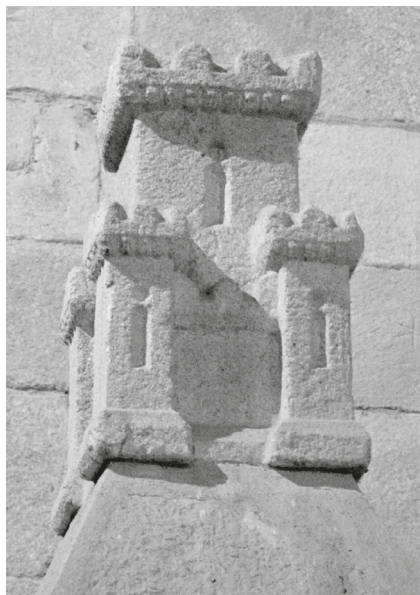
Fig. 7. Remate del baldaquino de Vilar de Donas.