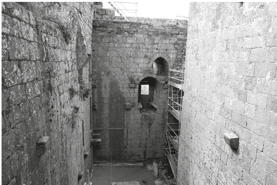
Fig. 3. Restos del palacio en el ángulo suroeste del interior del primer recinto.

noreste (B2) y la entrada principal en forma de arco apuntado (BI) en la esquina suroeste, amortizando el flanqueo de la torre adyacente 26 .