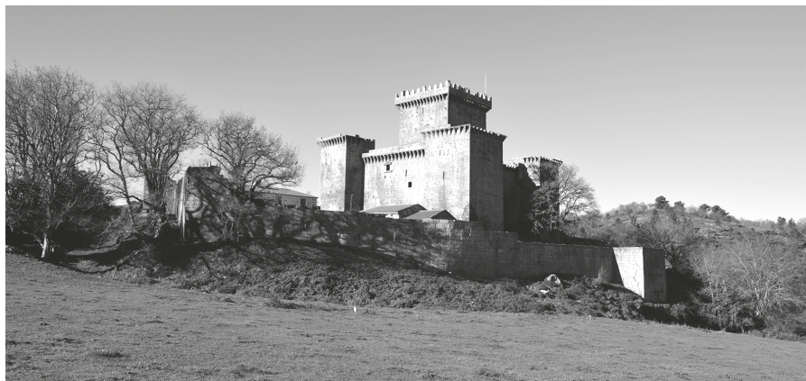
Fig. 4. Vista de la fortaleza desde el este.

sur (CI), protegida por un foso parcialmente colmatado y que contaría probablemente con un puente levadizo.