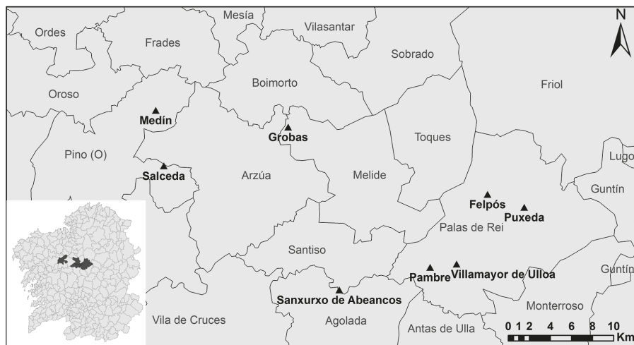
Fig. 1. Ubicación de las fortalezas de los Ulloa.

Cerca de la Ulloa, en Melide, se encuentra la fortaleza de Grobas en la parroquia homónima, reconstruida en tres ocasiones. Estuvo en posesión de Gonzalo Ozores de Ulloa, el constructor de Pambre, y fue derrocada por el arzobispo Juan García Manrique en una disputa con el noble. Tras su última reedificación queda rápidamente arruinada y en desuso, como atestigua el pleito Tabera-Fonseca 15 . Se conservan escasos restos arqueológicos en superficie.