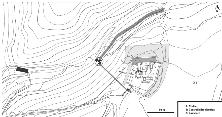
Fig. 8. Infraestructura productiva del entorno de la fortaleza. Realizado a partir del plano proporcionado por Crecente Asociados.

Supone uno de los primeros ejemplos de central hidroeléctrica rural gallega, por lo que posee un importante valor como patrimonio industrial 102 .