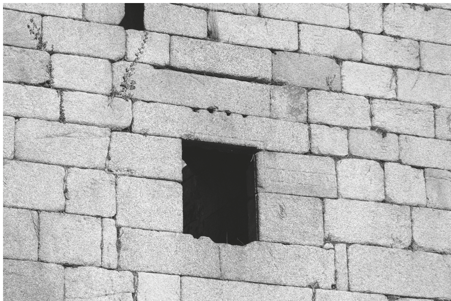
Fig. 6. Ventana en el lienzo sur del recinto interior, sobre la iglesia del patio de armas. Presenta los restos en negativo de un enrejado y la inscripción AVE MARIA en la parte derecha.

la parte más restringida de la fortaleza, en función de la cercanía y la confianza con el amo del castillo 87 . Frente a este largo recorrido, los servidores utilizarían un acceso mucho más directo a los distintos recintos a través de las poternas del este. Quedan así patentes las relaciones de poder y la desigualdad social, que son interpretadas por los distintos visitantes 88 .