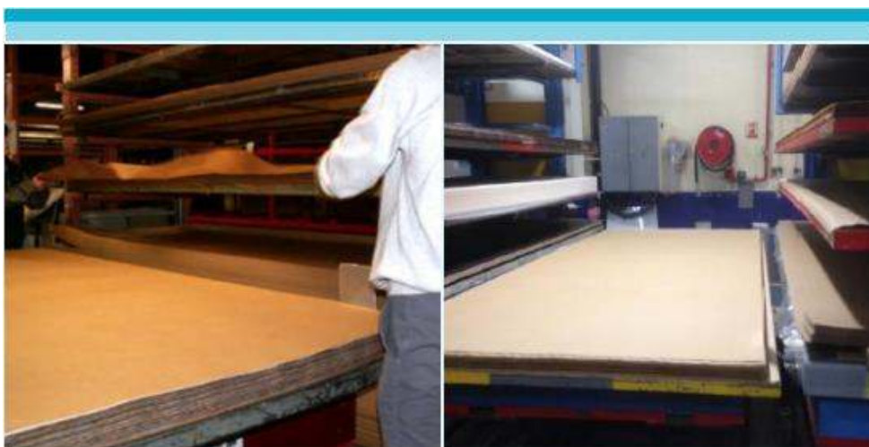
Figura 4: Mesa de empilhamento P4 com diferentes tipos de folhas sobre as estantes (decoração, overlay, kraft)