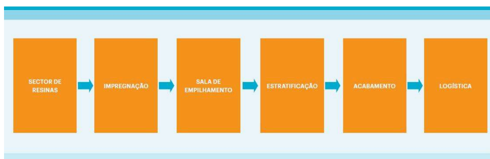
Figura 1: Processo de fabricação de painéis de madeira estratificados