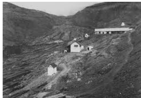
Gambar 3 & 4: Kondisi lahar dan bekas aliran lahar letusan Gunungapi Kelut tanggal 20 Mei 1919.

Ketika itu, suasana di Kota Blitar sangat mengerikan. Dalam gelap gulita terdengar hiruk pikuk suara orang berteriak menjerit minta tolong saling bersautan yang akhirnya senyap tak terdengar, tertutup oleh derasnya suara deru gemuruh dan gelegak membanjirnya air lahar panas yang menghancurkan apapun yang diterjangnya. Suara gemeretak dan dentuman robohnya berbagai bangunan maupun pepohonan besar