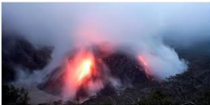
Gambar 7: Letusan Gunungapi Kelut membuat air danau mendidih tahun 2007.

Usahakan danau Gunungapi tersebut tidak mendapatkan tambahan air, oleh karena itu harus dibuatkan saluran pembuangan air yang kuat dan tidak mudah rusak.