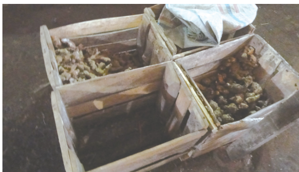
Foto 4.1. Jamu yang ada dalam kotak yang didatangkan dari Surabaya

Jadi Tanaman jamu yang ada di wilayah Desa Larangan Slampar sudah ada sejak jaman dahulu. Jamu ditanam di halaman rumah maupun di pekarangan adalah untuk penghasilan tambahan dari penghasilan sawah. Tanaman jamu ini tidak banyak membutuhkan penanganan yang