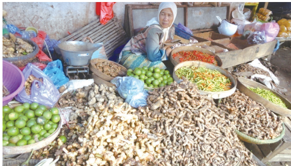
Foto 3.4. Bahan jamu yang dijual di Pasar Kolpajum