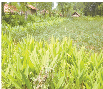
Foto 3.3. Tanaman bahan jamu yang berada di lahan sawah tadah hujan

seperti itu. Mereka memanennya hanya kalau membutuhkan, misalnya mau pergi ke pasar belanja, maka sehari atau dua hari sebelumnya sudah memanen bahan jamu. Dengan cara ini dimaksudkan bahan jamu yang akan dijual sudah kering dan tanah-tanah yang menempel di batang bahan jamu sudah berjatuhan, sehingga kelihatan bersih.