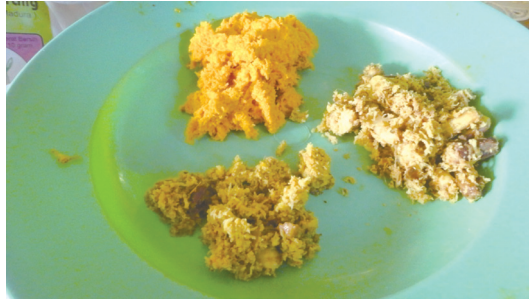
Foto 4.3. Jamu yang sudah diparut