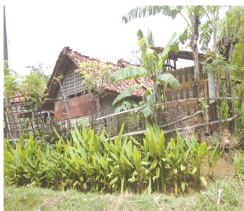
Foto 3.2. Tanaman Jamu yang ada di pekarangan rumah