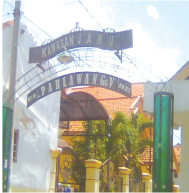
Foto 3.5: Kawasan industri jamu Jl. Pahlawan di Kalurahan Rongtengah Kecamatan Sampang Madura