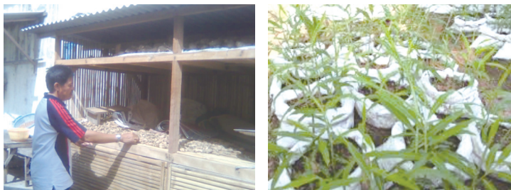
Foto 3.1: Pak Gofar memperlihatkan tempat penyimpanan jamu dan hasil tanamannya

Selain hal tersebut, bila tidak mempunyai lahan yang cukup, bisa ditanam di media plastik polybag , dengan media (tanah) subur berhumus, air secukupnya, adanya pemupukan dengan organik atau pupuk kandang