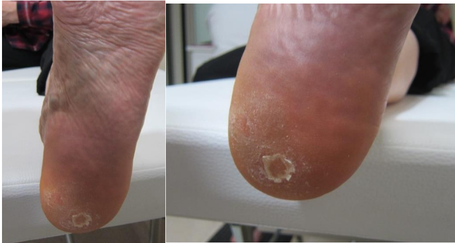
Figura 14. Lesión cicatrizada

decide realizar un tratamiento ortésico (Figura 15) de continuación como se planeó en un principio a la hora de valorar el tratamiento, el cual sería igual al tratamiento ortésico que se realizó desde un principio para el pie derecho (base de eva pelite de 4 mm con forro Lunalastic de 1mm).