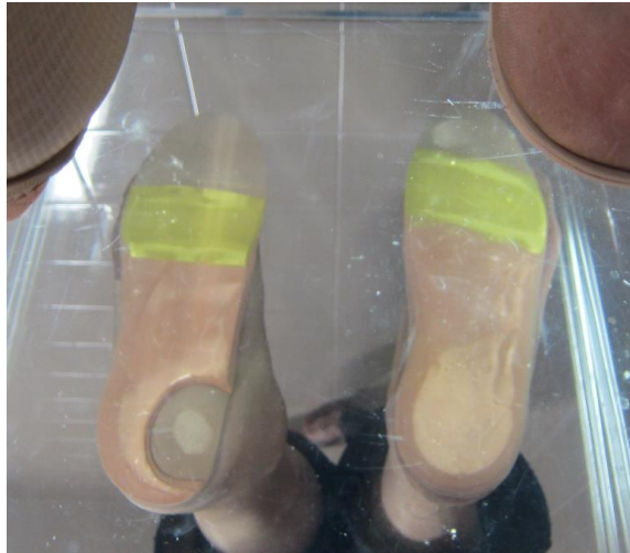
Figura 9. Vista en bipedestación sobre podoscopio con las ortesis plantares.