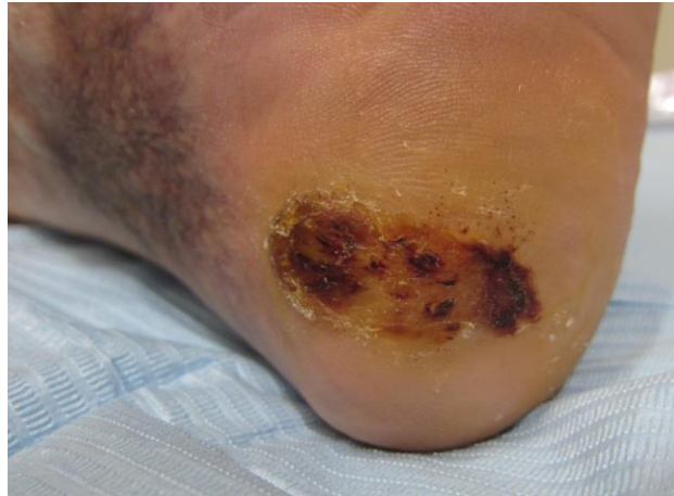
Figura 11. Lesión después de tres semanas de tratamiento.