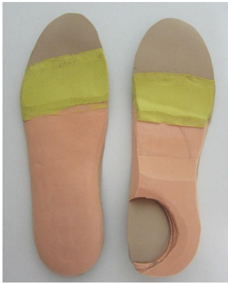
Figura 7. Ortesis plantares a medida con descarga selectiva.

El primer tratamiento consistió en una ortesis plantares a medida realizadas en su totalidad con un material medio blando. El diseño de la plantilla consistió en una base de EVA pelite de 4mm de grosor, con un forro Lunalastic de 1mm, esto para el pie derecho, e igual para el pie izquierdo, pero añadiéndole varias capas de EVA pelite en la zona de la lesión, realizando de este modo una descarga selectiva en forma de herradura (Figura 7).