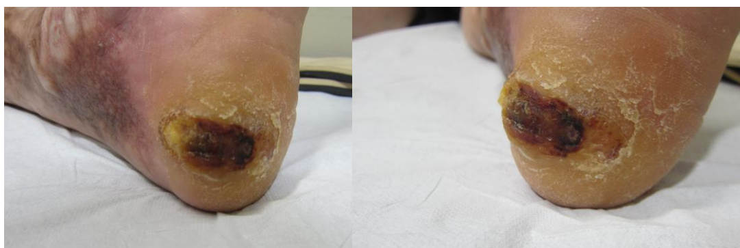
Figura 6. Aspecto de la lesión antes de comenzar el tratamiento ortésico.

Tras deslaminar la lesión en la anterior revisión, ya presenta otro aspecto, el cual deseamos que mejore con el posterior tratamiento (Figura 6).