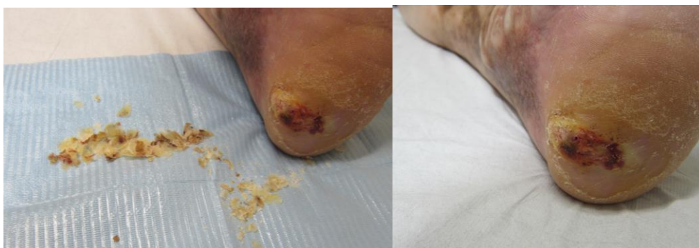
Figura 8. Aspecto de la lesión deslaminada.

Dado que la lesión presentaba una gruesa capa de hiperqueratosis, antes de aplicar el tratamiento de descarga, se le realiza un deslaminado de la lesión (Figura 8).