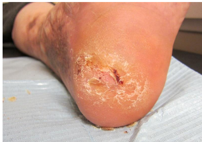
Figura 13. Aspecto de la lesión tras dos meses de tratamiento.

Transcurridos dos meses de tratamiento la lesión está prácticamente cicatrizada y es totalmente indolora (Figura 13). A pesar de los resultados obtenidos, se decide mantener a la paciente unas semanas más con el tratamiento de descarga para dejar epitelizar en su totalidad la lesión.