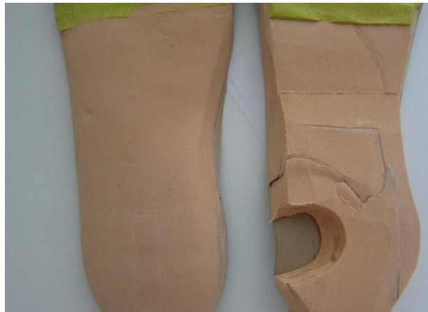
Figura 12. Disminución de la descarga en la ortesis.

Transcurridos dos meses de tratamiento la lesión está prácticamente cicatrizada y es totalmente indolora (Figura 13). A pesar de los resultados obtenidos, se decide mantener a la paciente unas semanas más con el tratamiento de descarga para dejar epitelizar en su totalidad la lesión.