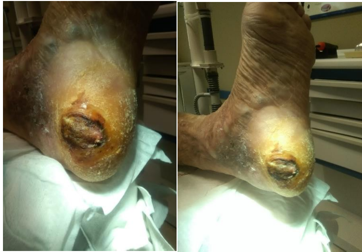
Figura 3. Aspecto de la lesión en la primera consulta.

Sobre el podoscopio en bipedestación (Figura 4), se observa una excesiva presión en la zona lesional. Además, podemos visualizar la gran controversia que existe entre ambas huellas plantares.