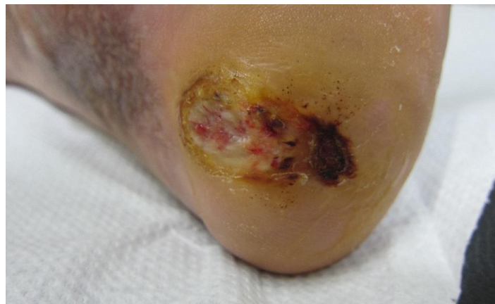
Figura 10. Aspecto de la lesión tras una semana de tratamiento.

Transcurrida una semana de la entrega de las ortesis, la paciente acude a consulta muy satisfecha ya que el dolor ha disminuido considerablemente y refiere una mayor estabilidad al caminar. A la exploración visual y palpatoria, la lesión presenta un mejor aspecto, habiendo conseguido una gran mejoría en un corto espacio de tiempo (Figura 10).