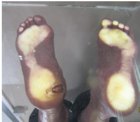
Figura 4. Imagen en bipedestación sobre el podoscopio.

Sobre el podoscopio en bipedestación (Figura 4), se observa una excesiva presión en la zona lesional. Además, podemos visualizar la gran controversia que existe entre ambas huellas plantares.