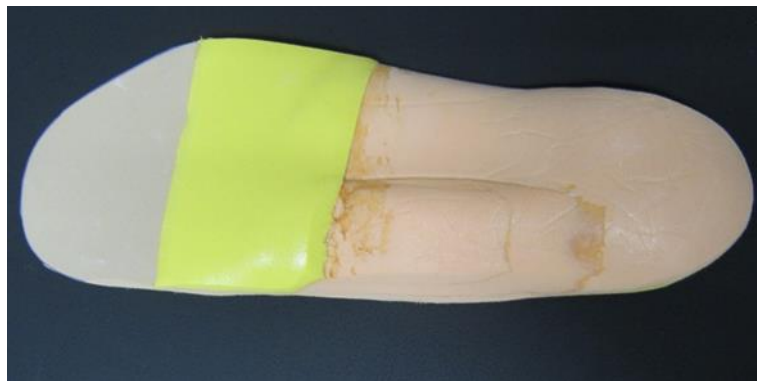
Figura 15. Nuevo tratamiento ortésico para pie izquierdo

Tras 2 meses llevando el nuevo tratamiento ortésico en el pie izquierdo notamos que se vuelve a generar cierta hiperqueratosis en la antigua zona lesional. Por este motivo decidimos que la paciente vuelva al tratamiento anterior con la ortesis de descarga para dicho pie, el cual la paciente todavía conservaba por su buen estado, ya que podría volverse a formar la úlcera tras mucho tiempo sin la descarga.