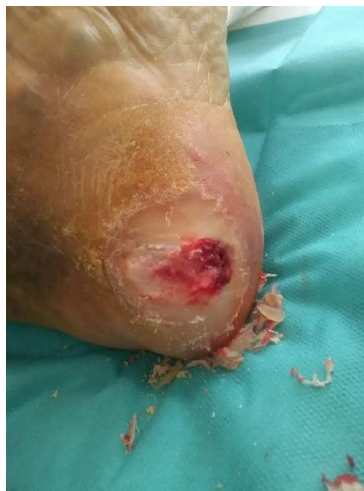
Figura 5. Aspecto de la lesión tras deslaminación exhaustiva.

En un primer lugar, tras una primera valoración se decide deslaminar la lesión (Figura 5).