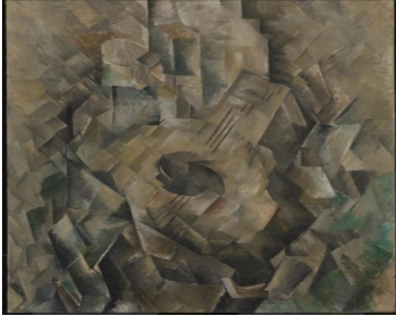
Resim 1: Georges Braque, Mandora, 1909 - 1910. Tuval Üzerine Yağlıboya, 71,1 x 55,9 cm.

etkilendiğini gösteren önemli bir yapıt, Georges Braque'ın (1882 – 1963) 1909 – 1910 tarihleri arasında yaptığı Mandora adlı çalışmadır. Çalışmada yapılan çalgı, birçok açıdan resmedilmiştir. Bu anlayışın temeli, duyuların yanıltıcı olduğu, bu bağlamda duyularla algıladığımız dünyanın gerçekliği yansıtmadığı düşüncesidir. Söz konusu çalgı da duyuların algıladığı çerçevede değil, zihnin algıladığı çerçevede bilinen perspektif kuralları aşılarak, tek bakış açısı kırılarak, yansıtılmıştır.