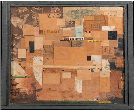
Resim 3: Kurt Schwitters, Merz, Resim 12b, Aşk Planı, 1919 - 23, Kağıt Üzerine Karışık Teknik, 43 x 32,5 cm, Metropolitan Sanat Müzesi, New York.