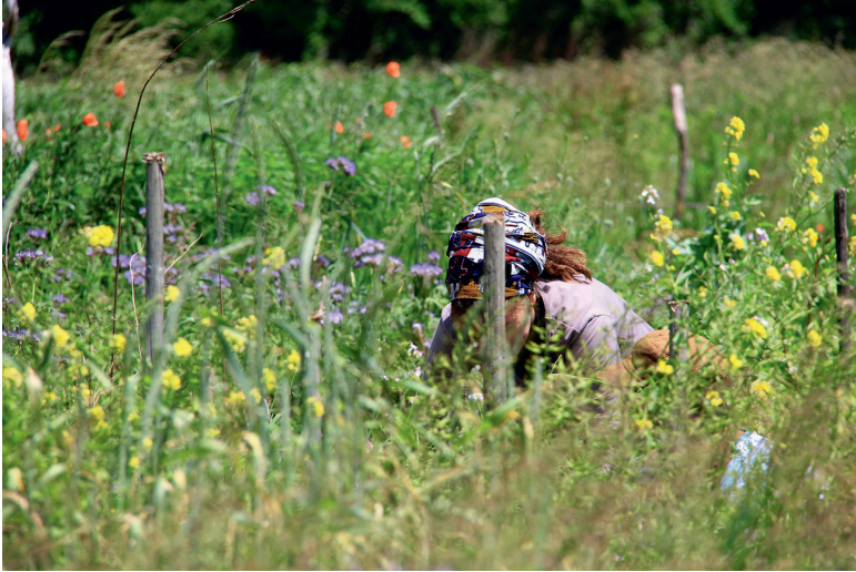
2. Permacultrice dans son milieu, Martigny (Suisse) © photo : Leila Chakroun, 2014.

conscient de son monde, par sa ré-humanisation (dimension symbolique) et sa dés-anthropisation (dimension technique). Par cette expérience en première personne, il y a somatisation d'un nouveau monde possible et cosmisation (à travers le design ) de ce possible en une nouvelle réalité. C'est par cette trajection que l'individu devient permaculteur et qu'un lieu devient permaculturé .