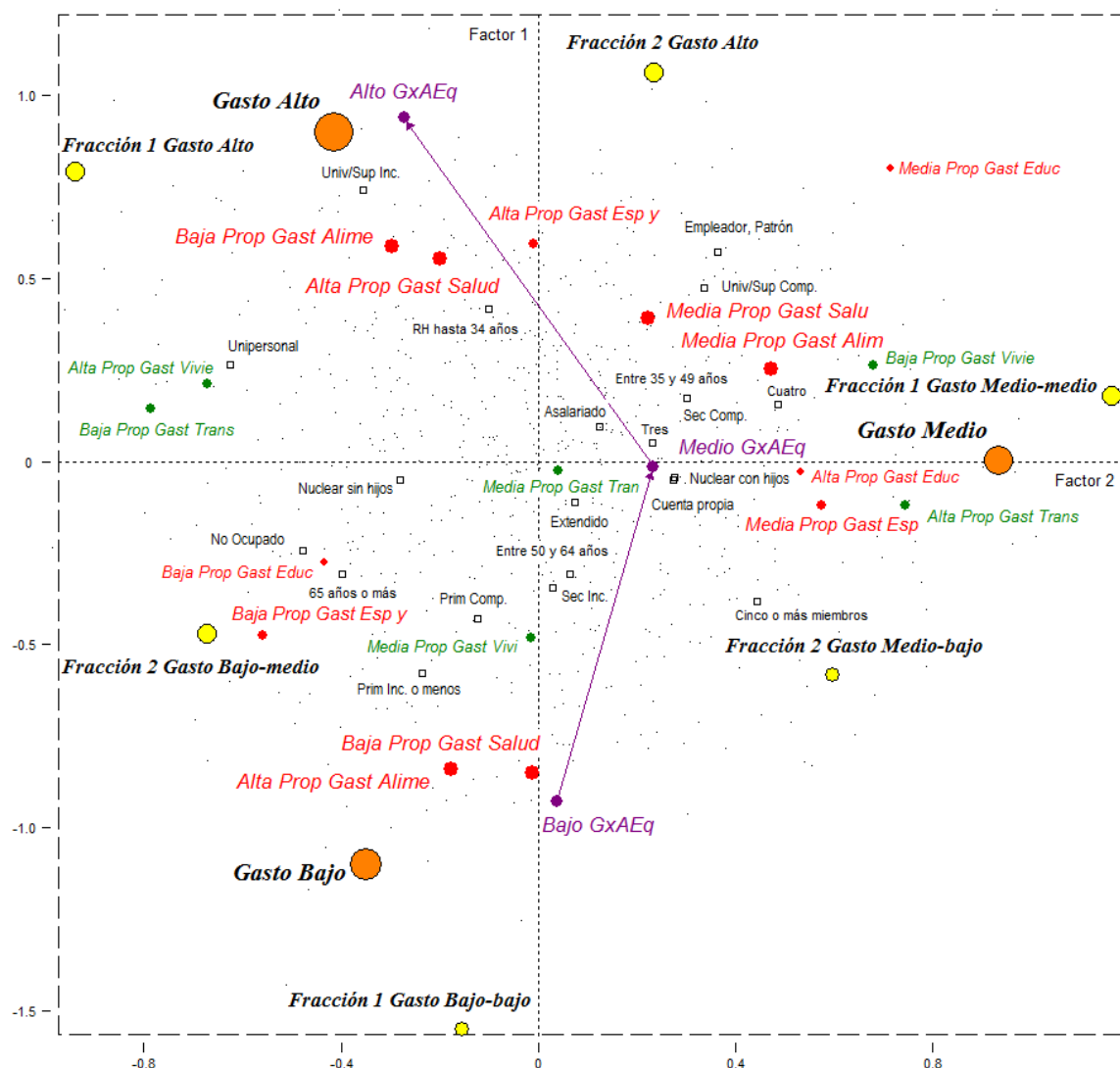
Diagrama 1.1: La estructura del gasto de los hogares cordobeses. 1° y 2° factor (79,3% de inercia)

Todo parece indicar que este primer factor se ordena conforme el volumen del gasto total y así decidimos mostrarlo en el diagrama a través de la línea que une las categorías de esa variable. Expresando el 63,3% de la inercia total (siempre a partir de la corrección de los valores propios), se encuentra conformado principalmente por las contribuciones de las variables que remiten al Gasto total (26,9), al gasto en Atención Médica del RH (18,8) y el gasto en Alimentos y Bebidas (17,1). También contribuyen, pero en menor medida, los