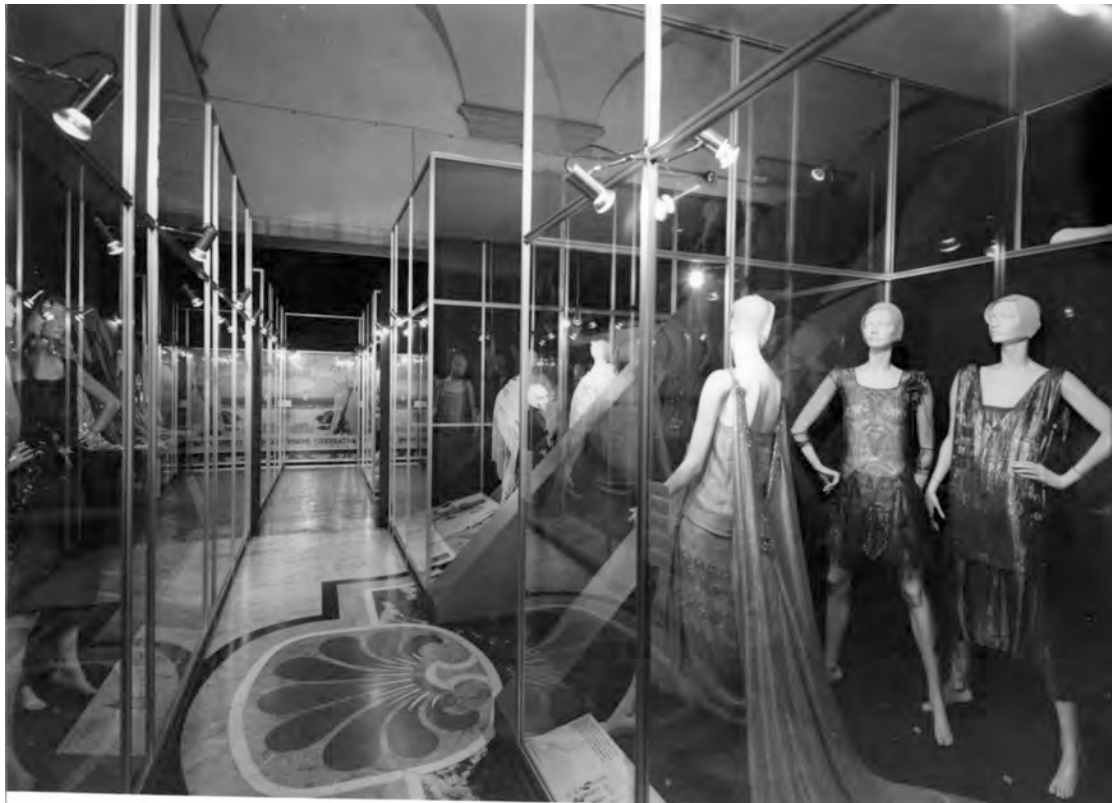
Figura 1: La mostra 1922–1943: Vent'anni di moda italiana , a cura di Grazietta Butazzi, Milano, Museo Poldi Pezzoli, 5 dicembre 1980–25 marzo 1981.