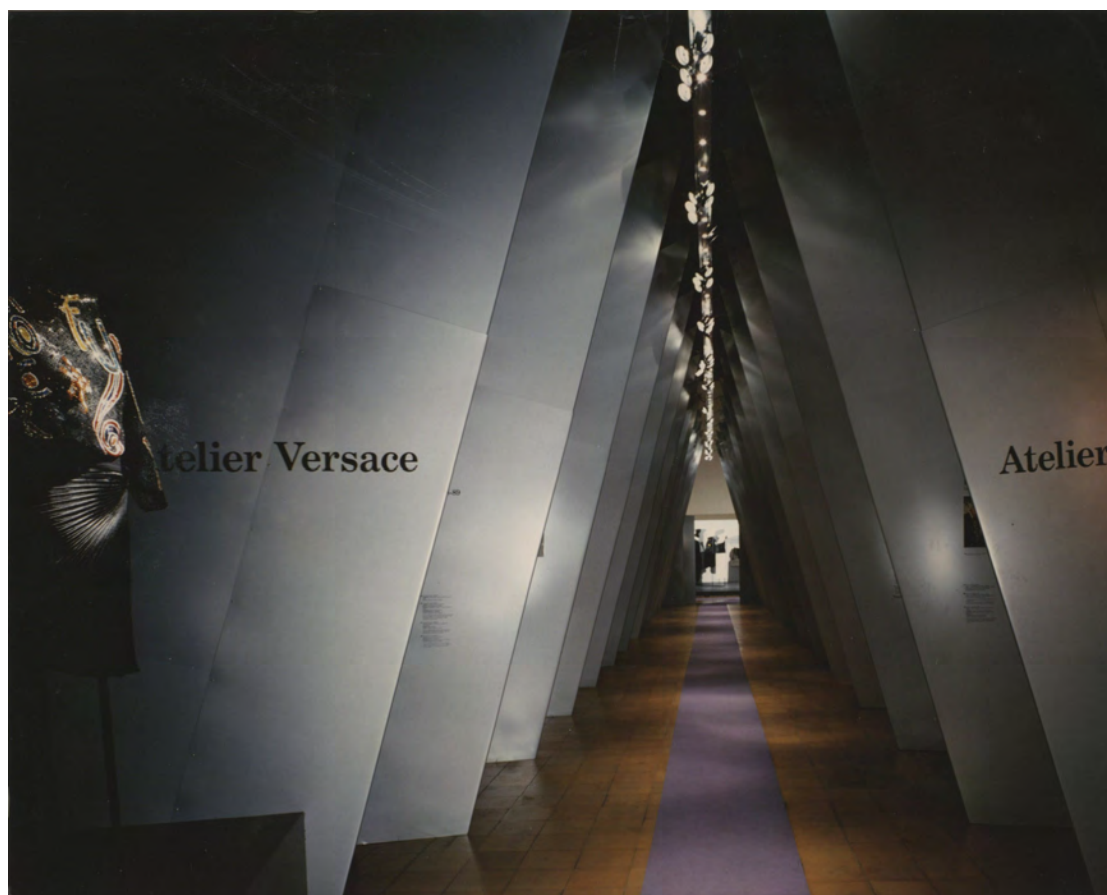
Figura 14: La mostra Gianni Versace: L'abito per pensare , a cura di Nicoletta Bocca con la collaborazione di Chiara Buss, Milano, Castello Sforzesco, 14 aprile-21 maggio 1989.

La mostra 60 era allestita su progetto dell'architetto Gianfranco Cavaglià con le luci di Piero Castiglioni nella Sala della Balla 61 al primo piano del Castello Sforzesco. Sul Corriere della Sera Laura Dubini parla di "chiarezza didascalica" del percorso espositivo, equiparato a quello di una monografica dedicata a un artista, perché il visitatore poteva cogliere i tratti specifici dello stile Versace: dal drappeggio, alle asimmetrie, ai materiali tecnologici, al desiderio di eccesso neobarocco. 62 La sala era scandita da una struttura architettonica che utilizzava pannelli tagliati obliquamente rispetto al pavimento (un'allusione alla metà della lettera "V") che ritagliavano nello spazio una serie di nicchie, dedicate alle collezioni (rappresentate sinteticamente da tre pezzi) e suddivise secondo i temi nei quali la mostra era articolata (Fig. 14).