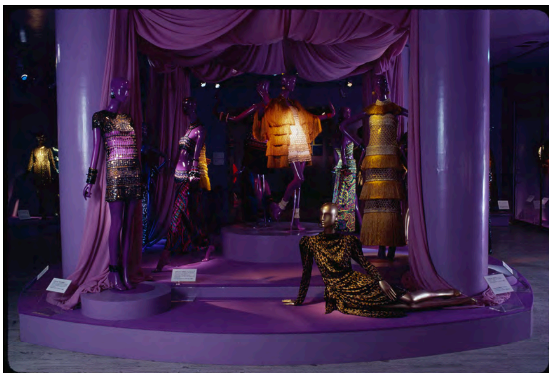
Figura 10: La mostra Yves Saint Laurent: Twenty-five years of design , a cura di Diana Vreeland, New York, The Metropolitan Museum of Art, The Costume Institute, 14 dicembre 1983–2 settembre 1984.

si configurava come uno statement sul grande contributo di Saint Laurent alla moda del ventesimo secolo, ovvero la sua capacità di lavorare sull'evoluzione delle proporzioni nella costruzione sartoriale che aveva definito e stava definendo la donna contemporanea. Non mancava quindi un'attenzione a elementi specifici del progetto di moda, anche se questo aspetto tendeva a perdersi nel percorso complessivo. In sostanza, Vreeland ha anche inaugurato soluzioni allestitivie inedite.