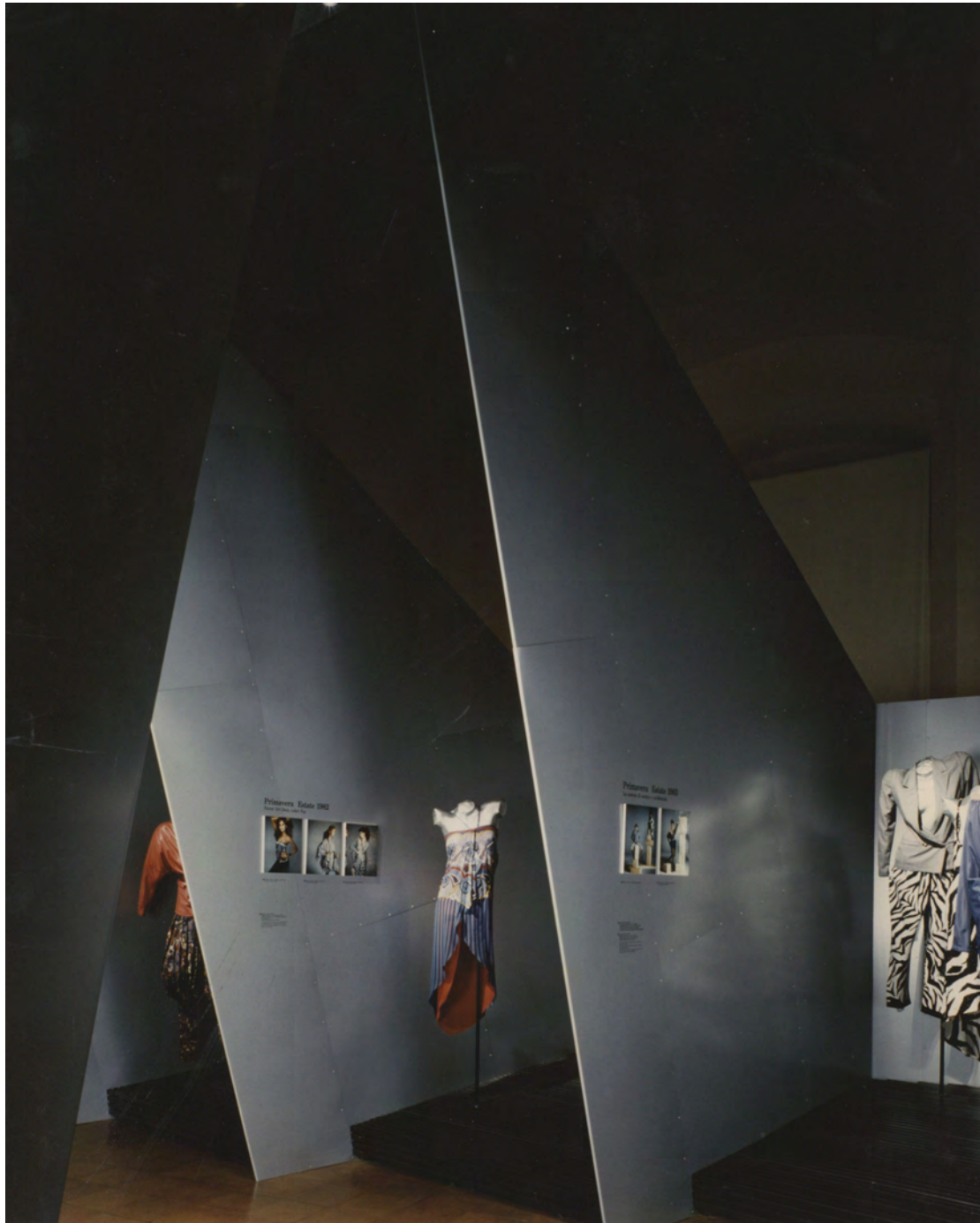
Figura 15: La mostra Gianni Versace: L'abito per pensare , a cura di Nicoletta Bocca con la collaborazione di Chiara Buss, Milano, Castello Sforzesco, 14 aprile-21 maggio 1989.