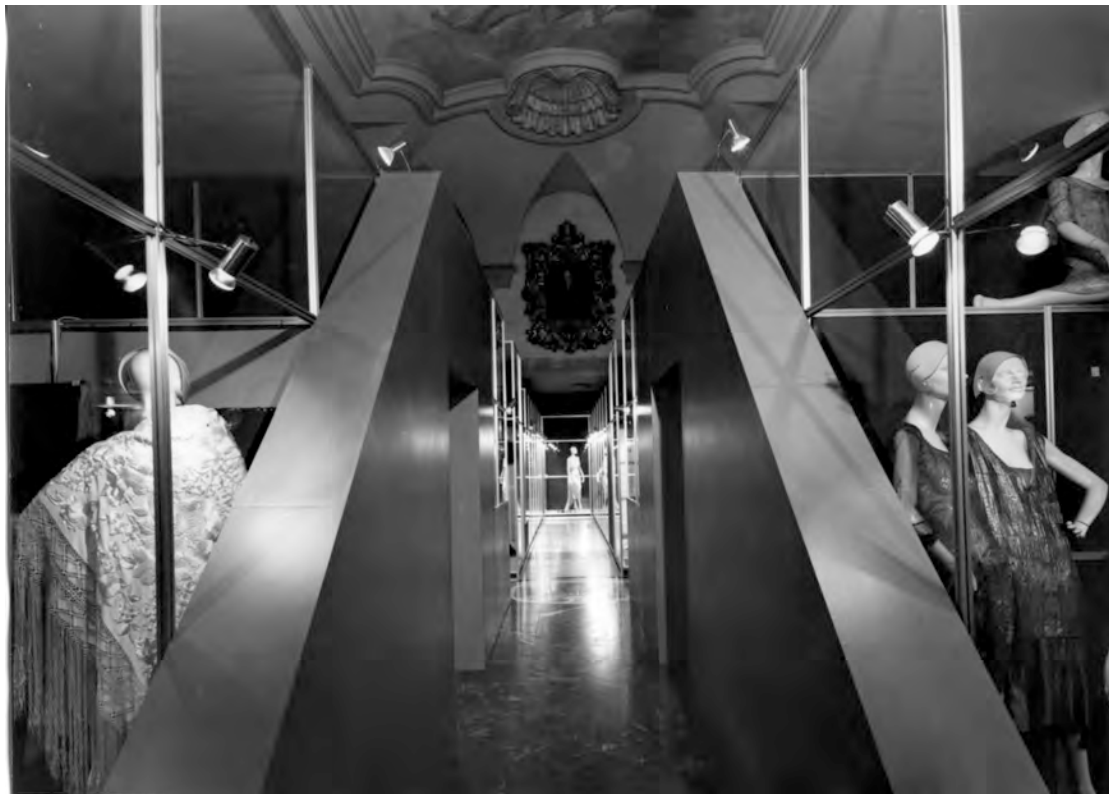
Figura 2: La mostra 1922–1943: Vent'anni di moda italiana , a cura di Grazietta Butazzi, Milano, Museo Poldi Pezzoli, 5 dicembre 1980–25 marzo 1981. © Milano, Museo Poldi Pezzoli