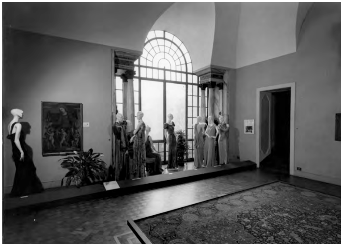
Figura 4: La mostra 1922–1943: Vent'anni di moda italiana , a cura di Grazietta Butazzi, Milano, Museo Poldi Pezzoli, 5 dicembre 1980–25 marzo 1981. © Milano, Museo Poldi Pezzoli

Fra le opere conservate ed esposte nel museo era disseminata una serie di gruppi di manichini in dialogo fra loro (nel Salone dorato l'installazione metteva in relazione manichini seduti e in piedi, di fronte alla grande finestra, secondo un modello che ricordava una conversation piece ) (Fig. 4).