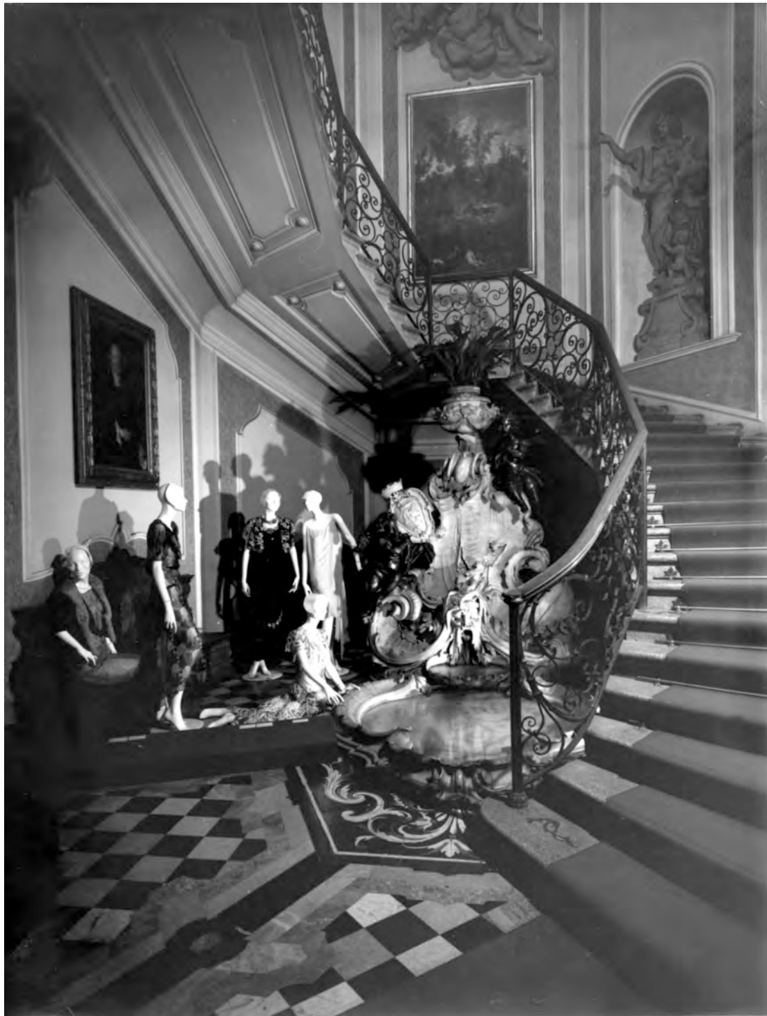
Figura 3: La mostra 1922–1943: Vent'anni di moda italiana , a cura di Grazietta Butazzi, Milano, Museo Poldi Pezzoli, 5 dicembre 1980–25 marzo 1981.