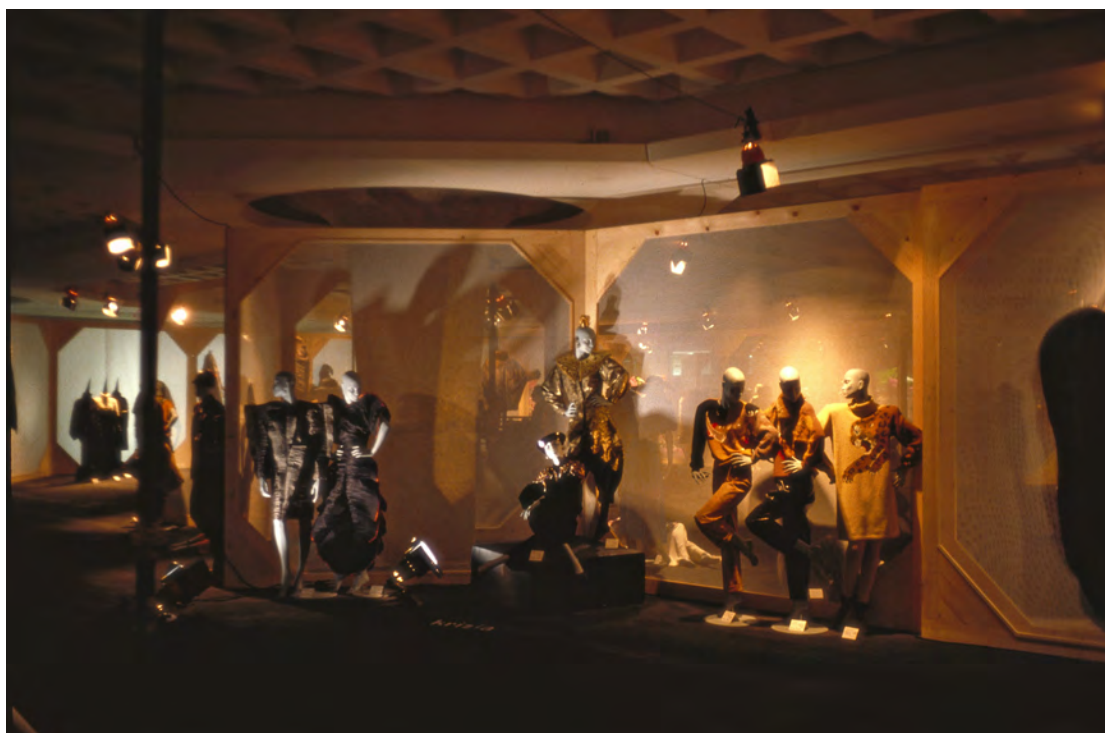
Figura 7: La mostra Il genio antipatico: Creatività e tecnologia della moda italiana 1951–1983 , a cura di Pia Soli, Roma, Salone dei congressi del parcheggio al Galoppatoio di Villa Borghese, aprile–maggio 1984.

Anche se è molto difficile recuperare immagini dell'allestimento di questa mostra, due piccole fotografie sono pubblicate sul numero di Domus del luglio–agosto 1984 e accompagnano un breve testo di presentazione redatto da Maria Pia Bobbioni a proposito della tappa romana (Figg. 7 e 8).