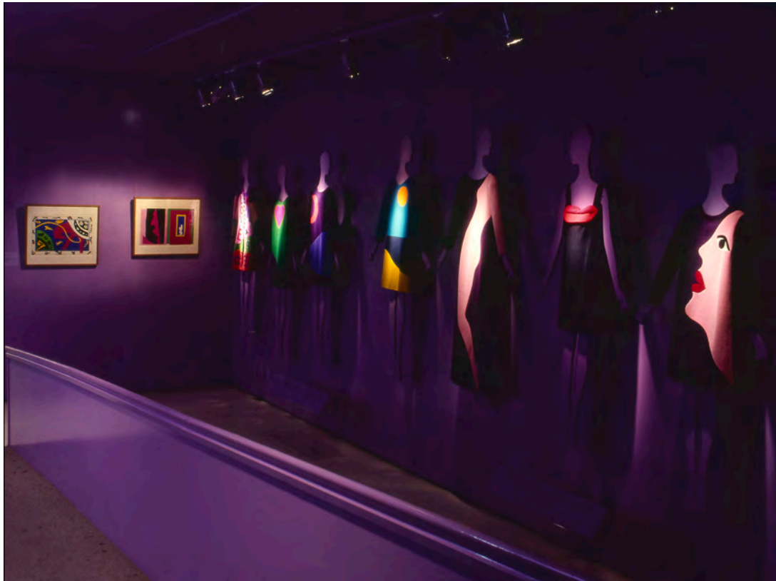
Figura 11: La mostra Yves Saint Laurent: Twenty-five years of design , a cura di Diana Vreeland, New York, The Metropolitan Museum of Art, The Costume Institute, 14 dicembre 1983–2 settembre 1984.