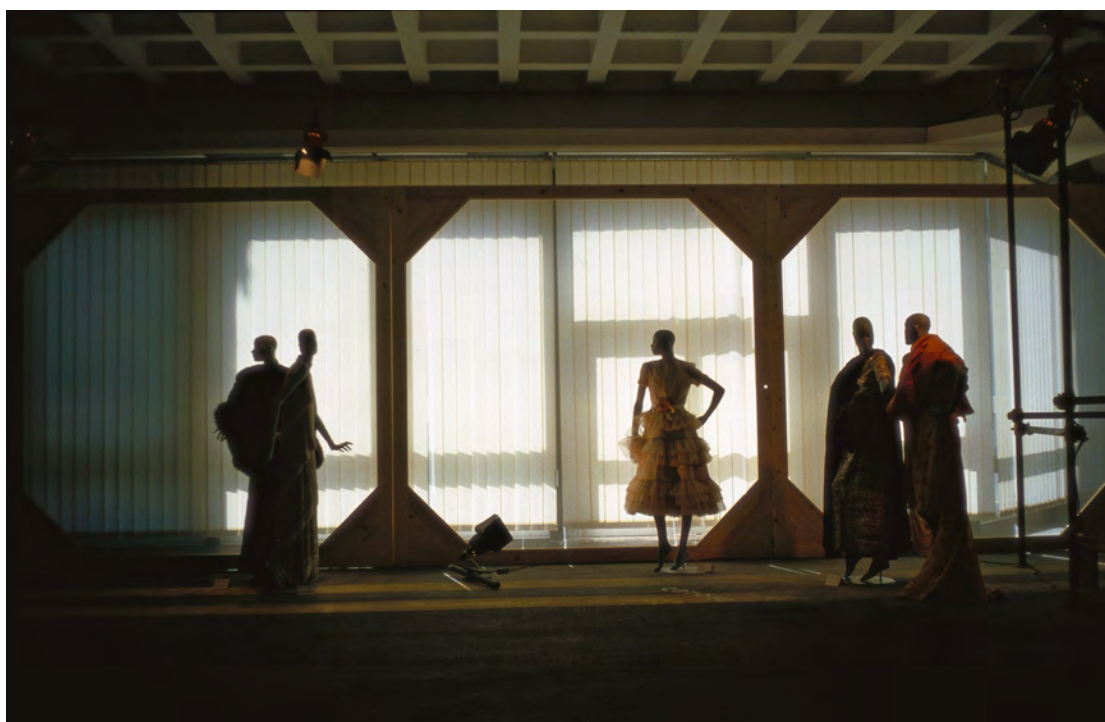
Figura 8: La mostra Il genio antipatico: Creatività e tecnologia della moda italiana 1951–1983 , a cura di Pia Soli, Roma, Salone dei congressi del parcheggio al Galoppatoio di Villa Borghese, aprile–maggio 1984.

trasformando in un marchio di fabbrica, anche per molte mostre di moda che sarebbero venute dopo di lei) al Costume Institute del Metropolitan Museum di New York.