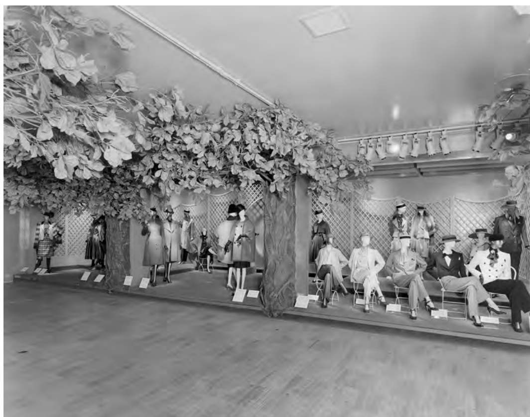
Figura 12: La mostra Yves Saint Laurent: Twenty-five years of design , a cura di Diana Vreeland, New York, The Metropolitan Museum of Art, The Costume Institute, 14 dicembre 1983–2 settembre 1984.

Vreeland, controversa, mediatica, dittatoriale, ha però riconosciuto alla moda contemporanea, in tutte le sue manifestazioni, un ruolo centrale come chiave d'accesso alla comprensione della cultura contemporanea, nella sua accezione più ampia e complessa allo stesso tempo. Richard Martin e Harold Koda 54 nel ricordare la sequenza di mostre curate da Vreeland al Costume Institute insistono nel sottolineare che pur nel progetto di spettacolarizzazione della moda in mostra, non mancavano tentativi di sottolineare la dimensione progettuale della moda, attraverso un'attenzione specifica alla definizione di quegli elementi che definiscono gli abiti e la loro storia sartoriale. 55 Nel lavoro di Vreeland al Costume Institute, il fashion curating iniziava, con alcuni gesti accennati sicuramente da sviluppare, a essere inteso come pratica che poteva coniugare elementi spettacolari, più immediatamente connessi con la cultura visuale e gli immaginari che appartengono alla moda, alla riflessione culturale (Fig. 12).