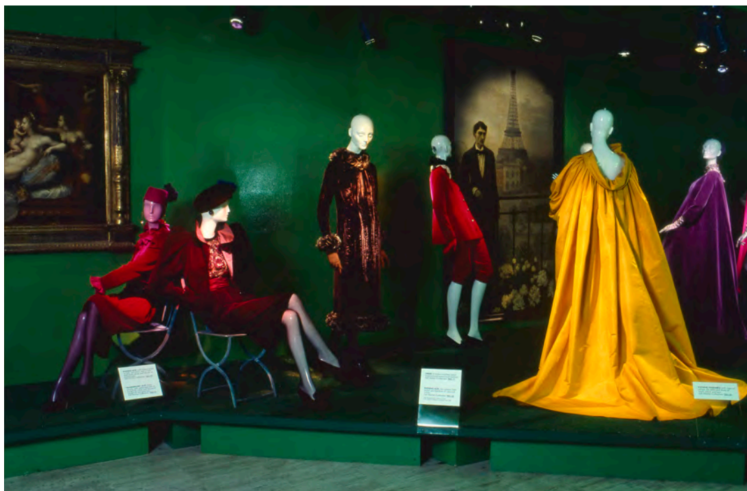
Figura 9: La mostra Yves Saint Laurent: Twenty-five years of design , a cura di Diana Vreeland, New York, The Metropolitan Museum of Art, The Costume Institute, 14 dicembre 1983–2 settembre 1984.

L'immaginazione editoriale della Vreeland, quindi, dominava la mostra, che si configurava principalmente come una sequenza di conversation piece fra manichini, non avvicinati per ragioni cronologiche, ma principalmente sulla base di suggestioni cromatiche e di temi (Fig. 9), come l'evocazione di un altrove esotico creato attraverso riferimenti a un'idea del Marocco o della Russia.