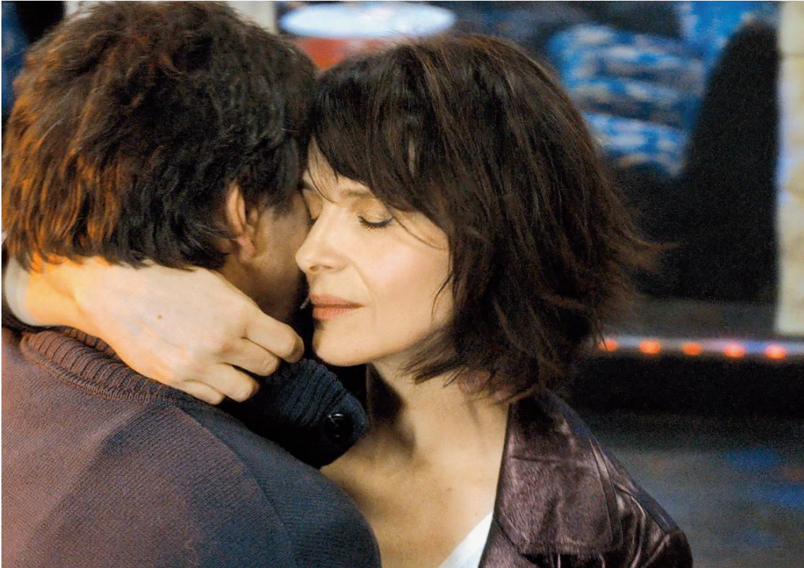
Un beau soleil intérieur (Claire Denis, 2017)