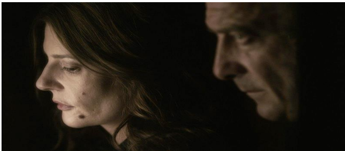
Les salauds (Claire Denis, 2013) 24

En Nénette et Boni , els germans es retroben després de que ella s'escapi de la casa del pare, després de descobrir que està embarassada i es mudi a la casa d'ell, un apartament que comparteix amb altres nois. Boni té una obsessió amb la fornera del seu carrer i els seus pensaments constantment giren al voltant de la seva frustració sexual. Nénette, coneixedora d'aquest fet, juga a provocar-lo. Així, lentament, recuperen l'afecte que es tenien quan eren nens. Cap al final, la maternitat no desitjada de Nénette fa créixer dins de Boni un desig d'autorealització a partir del nadó, segrestant-lo fins i tot per evitar que ella el doni en adopció, mentre la seva germana, una vegada ha tingut el bebè, busca àvidament poder fumar, entre les burilles del cendrer. És fàcil imaginar-se que la vida d'aquesta parella de germans els va portar per camins inesperats fins a esdevenir la relació de Marc i Sandra Silvestri, protagonistes de Les salauds .