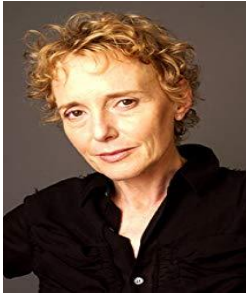
Claire Denis (Paris, 1946) 55

Probablement el cinema de Denis resumeix la idea de que el cos sensorial a part de ser susceptible de ser mirat necessita de forma imperiosa ser tocat. Aquesta reivindicació hàptica, gens habitual ni majoritària en el cinema contemporani, ensenya la dimensió carregada de matèria en una filmografia al nostre entendre, molt pertinent i destinada encara a trobar nous recorreguts. En poques ocasions el cinema ha reivindicat el cos físic i el seu entrecreuament amb l'altre a través d'unes pel·lícules que formen part de l'imaginari més trencador del cinema contemporani.