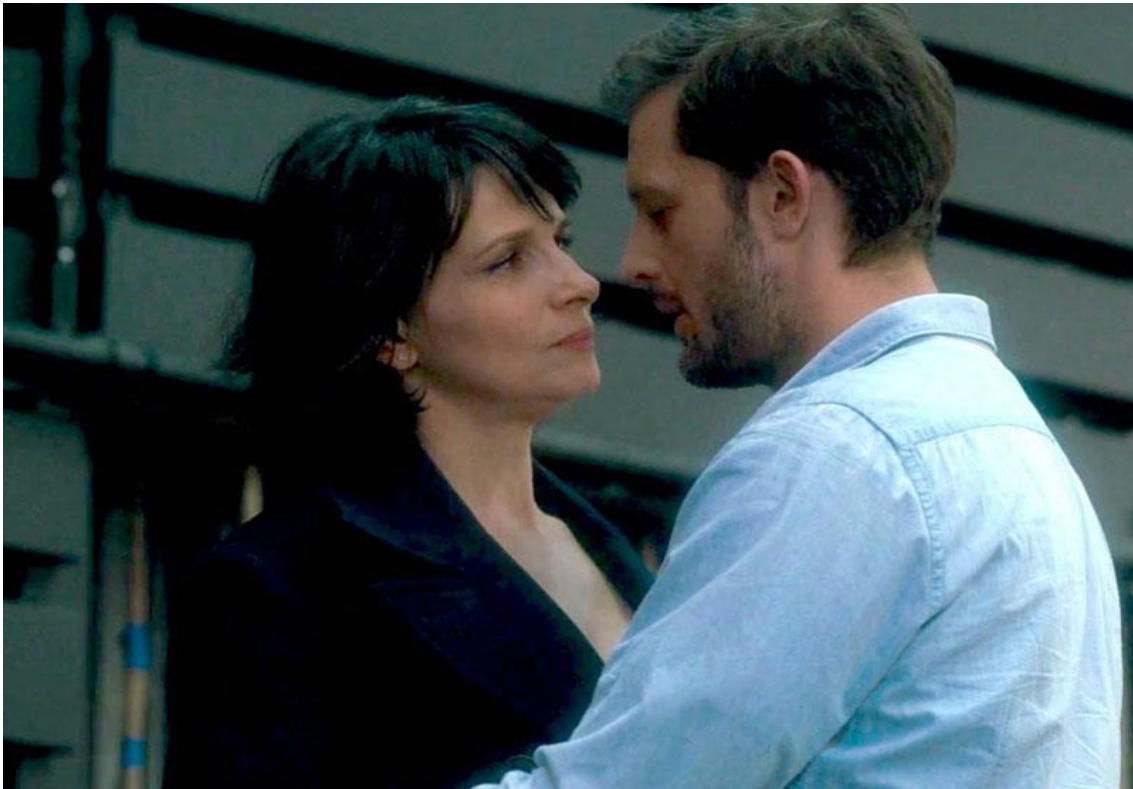
Un beau soleil intérieur (Claire Denis, 2017) 50

Així mateix, Illouz considera que les emocions presenten un caràcter " pre-reflexiu i sovint semi-conscient " atès que són el resultat d'elements socials i culturals que escapen de la decisió conscient dels subjectes. Em pregunto que diria un autor com Spinoza d'aquesta disparitat cos-ment. Perquè en qualsevol cas, en un discurs amorós no existeix un principi o un final sinó que és un procés en construcció i en el seu recorregut es requereix un treball permanent. Pot ser probable que la disjuntiva de la Binoche en la pel·lícula sigui que està a la recerca d'un ideal romàntic que és una quimera i que només es materialitzarà en un somni inexistent però el risc haurà volgut la pena.