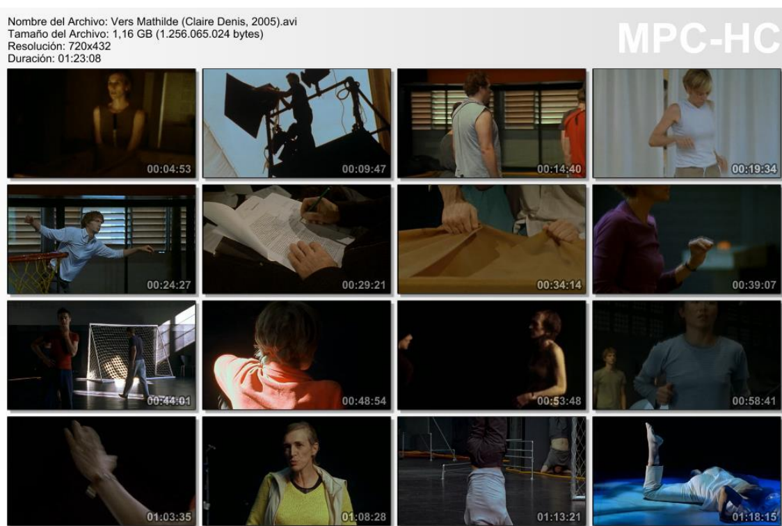
Vers Mathilde (Claire Denis,2005) 46