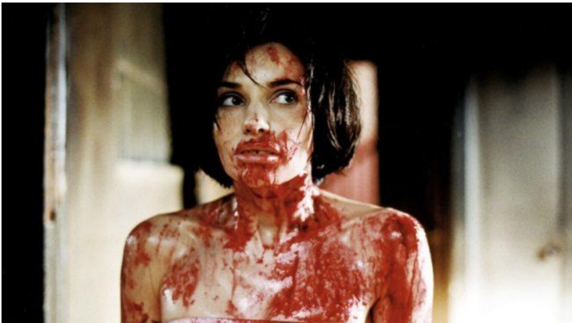
Trouble Every Day (Claire Denis, 2001)