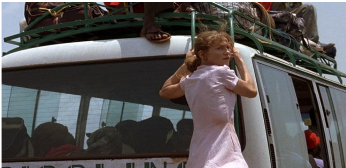
White Material (Claire Denis, 2009) 10

De quina forma es manifesta el necropoder en les guerres contemporànies?. Mbembe reprèn el terme de màquines de guerra de Deleuze i Guattari i analitza la situació de heteronomia que regeix els espais bèl·lics moderns. Les màquines de guerra són faccions armades, no sempre exèrcits estatals, difuses i polimorfes, que es formen i dissolen segons les circumstàncies. La seva tecnologia de combat i mobilitat permet a la guerra moderna ser extremadament ràpida, brutal, rendible i segura per a l'agressor.