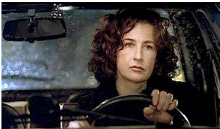
Vendredi soir (Claire Denis, 2002) 33

Hem parlat abans de Vendredi Soir com la sortida del cos en una plasmació d'una lectura de Spinoza. Ara convé desenvolupar-ho i llegir el film a partir de l'altre, d'aquell que ens torba però que ens sedueix. En Vendredi Soir , Laura (Valérie Lemercier), una parisenca de trenta i tants, es queda atrapada en un embús per culpa d'una vaga de transport públic la nit abans de començar la seva nova vida en comú amb el seu xicot François. Després de ficar totes les seves coses en caixes i deixar tot a punt per iniciar l'endemà la mudança, Laura agafa el cotxe per dirigir-se a un sopar amb els seus amics. Però París està paralitzat pel trànsit. La lentitud amb què avancen els cotxes provoca que la Laura es converteixi en l'objecte de mirades intruses. El vehicle és un lloc al mateix temps públic i privat, obert i tancat, interior i exterior. Per això l'altre es percep com una amenaça que no cal deixar entrar.