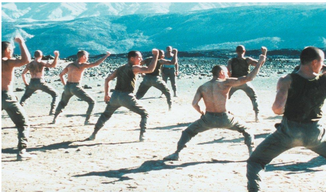
Beau travail (Claire Denis, 1999) 15

Aviat començaria a sentir una barreja de gelosia i desitjos reprimits pel jove perquè el seu superior també se sent atret per ell. Així que Galoup intenta mantenir a Sentain lluny de Bruno Forestier sortint fora de Djibouti, muntant campaments en zones àrides o arreglant