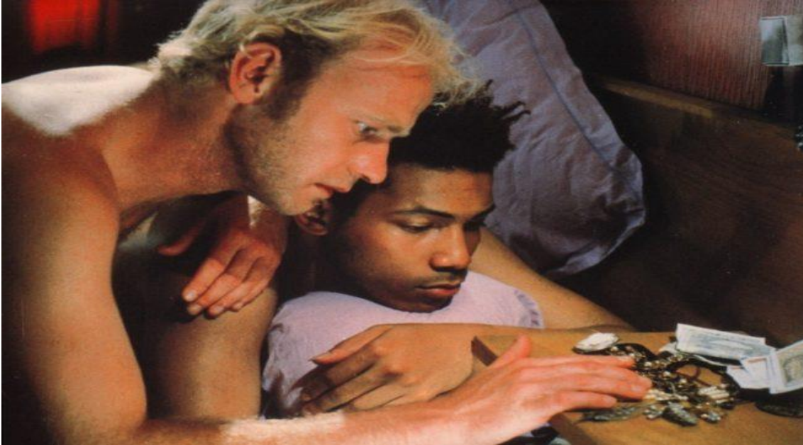
J'ai pas sommeil (Claire Denis, 1994) 25

implica a la seva pròpia filla i alts comandaments polítics del país. Marc s'assabentarà de tot això, mentre reconeix cada vegada menys a la seva germana. La similitud genètica sembla ser una carrega feixuga quan l'altre es revela com un desconegut; d'una banda en la intimitat poden compartir informació però cap a fora són uns estranys. En J'ai pas Sommeil , quan Camille és detinguda pels seus assassinats, un policia interpel·la Theo sobre el que faria si el detingut fos germà seu. Theo respon: « el meu germà és un estrany per a mi, així com tu. »