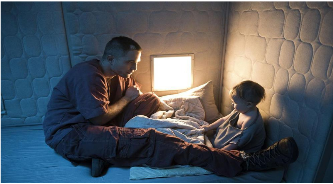
High Life (Claire Denis, 2018)