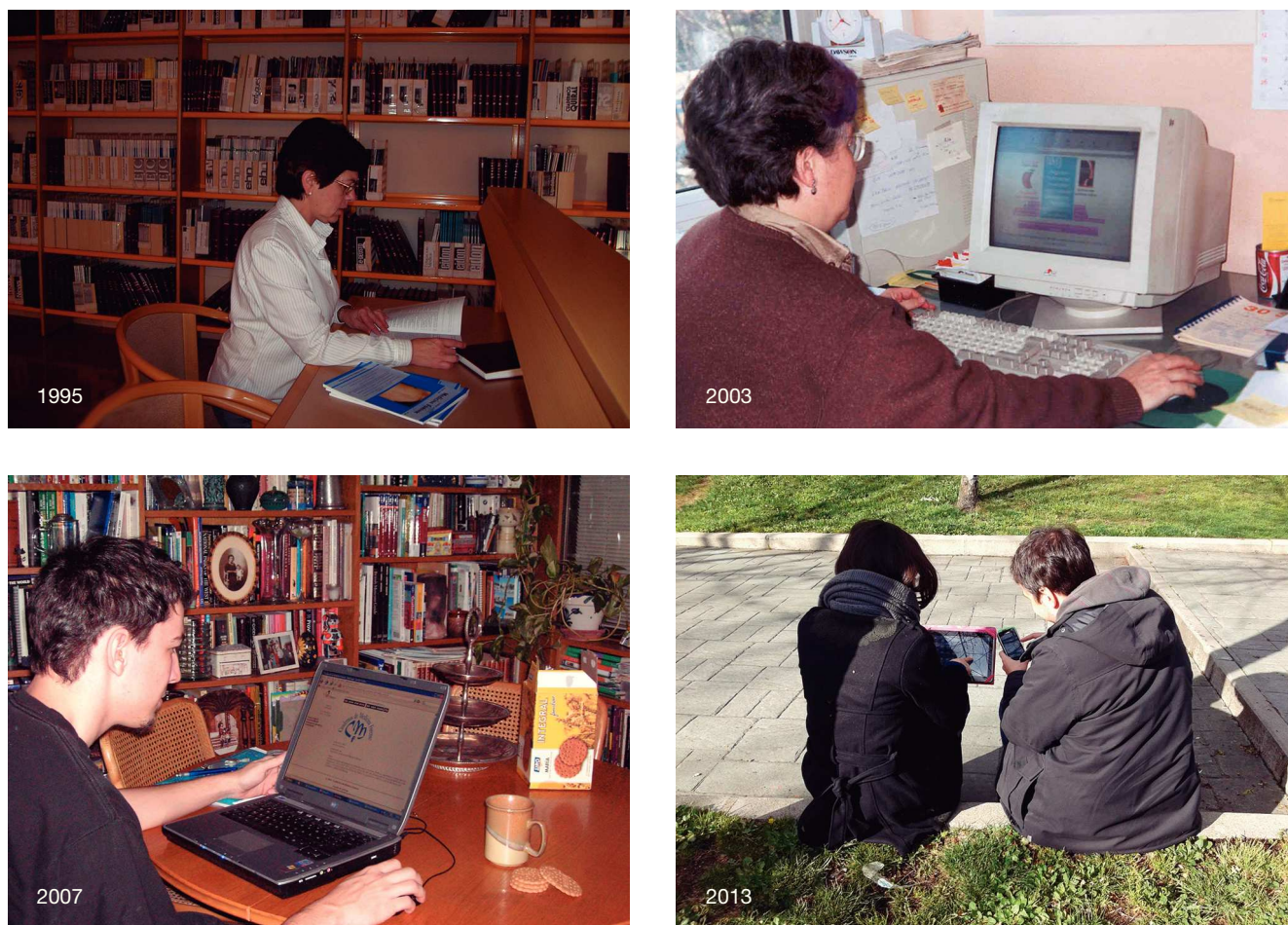
Figura 1 Evolución del acceso a la información científica en los últimos 20 años.

período 2005-2010, esta base de datos recogió un porcentaje de publicaciones en español por debajo del 1%, aunque similar al de otros idiomas como el alemán o el francés 5 . Existen otras bases de datos internacionales, algunas multidisciplinares, que también recogen producción científica biomédica, como Embase, Scopus o Web of Science, que mantienen el idioma inglés como mayoritario. Aunque estas bases de datos recogen parte de las revistas españolas que se publican en el área, no muestran una cobertura total, por lo que hay que acudir a bases de datos nacionales para poder acceder de forma más exhaustiva a la información relevante producida en España.